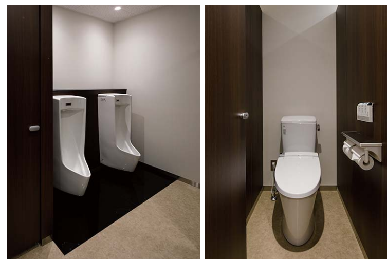
モップが奥まで届きやすい壁掛タイプの小便器。便器下には尿垂れを考慮した汚垂石も設置し、床の清掃性を向上させている。