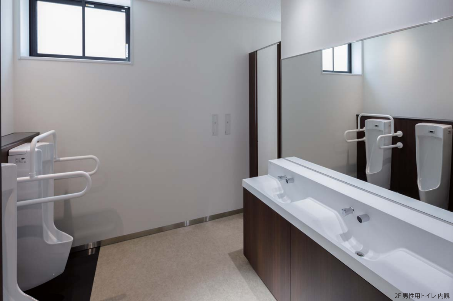
2F 男性用トイレ 内観