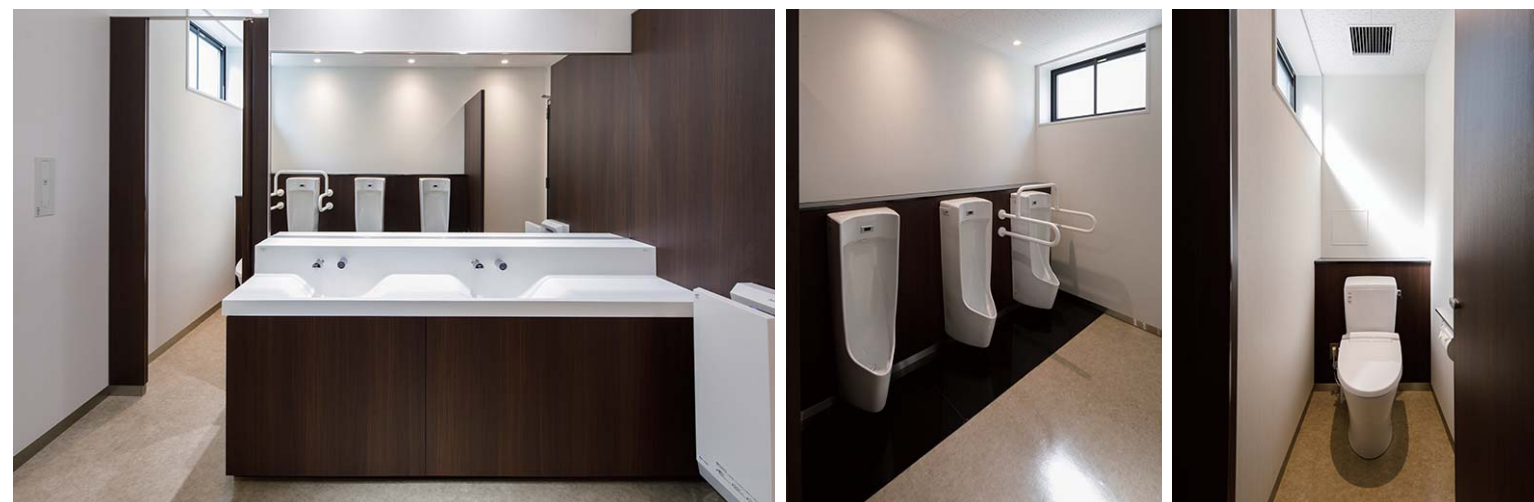
窓からの自然光を取り入れた明るい室内。洗面カウンターは継ぎ目がないボウル一体形で汚れや水アカが溜まりにくくなっている。自動水栓や水石けん供給栓は汚れにくい壁付けタイプで清掃性に配慮。手荷物を置けるシェルフも備えているのでゆったりと手を洗うことができる。