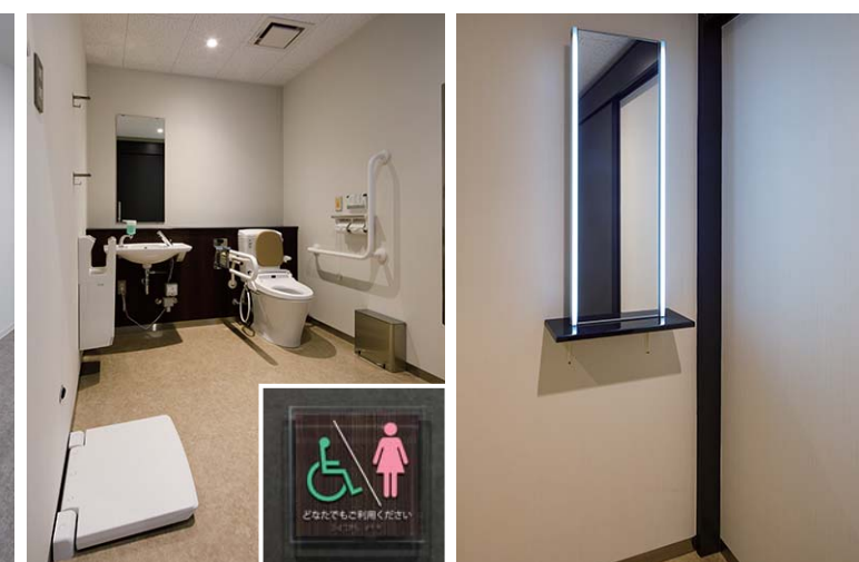
多目的トイレには女性配慮として、フロント照明付鏡を備えたパウダーコーナーやストッキング交換等に便利なチェンジングボードを設けている。