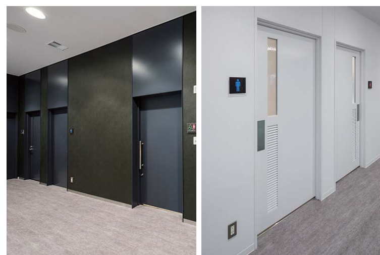
左:1Fトイレ・シャワー室入り口/右:2Fトイレ入り口