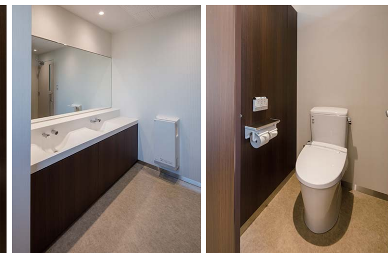
ダークブラウンの木目が落ち着いた雰囲気を作り出すトイレ空間。1枚鏡が空間に広がりを見せ、奥行きを感じさせている。