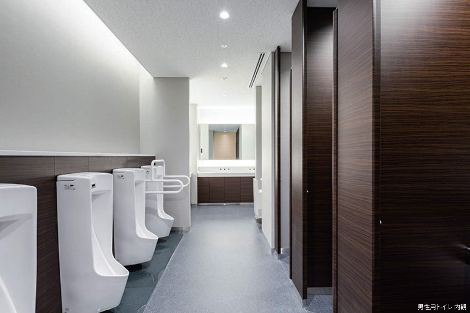
男性用トイレ 内観