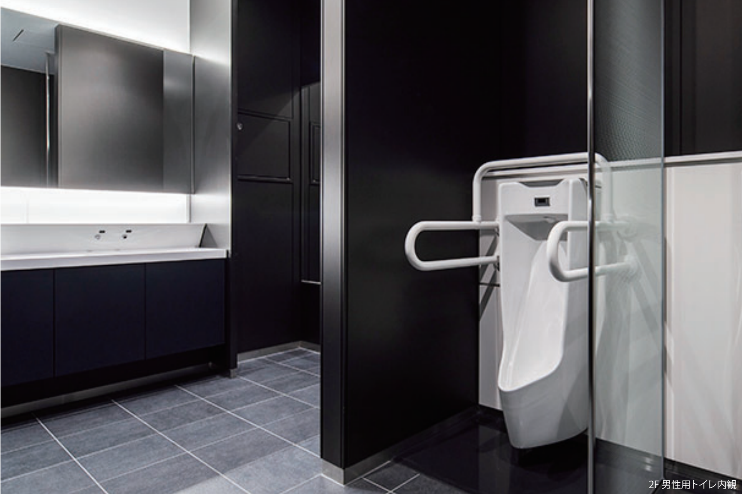
2F 男性用トイレ内観