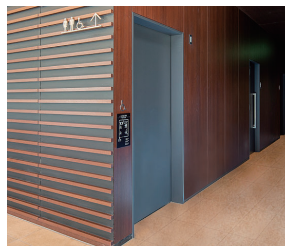
2F トイレ入り口まわり

掲載内容及び写真・図版の無断転載はかたくお断りします。(許可なく転載・流用した場合、損害賠償が発生します。)