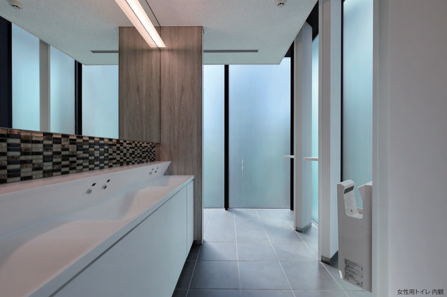
女性用トイレ 内観