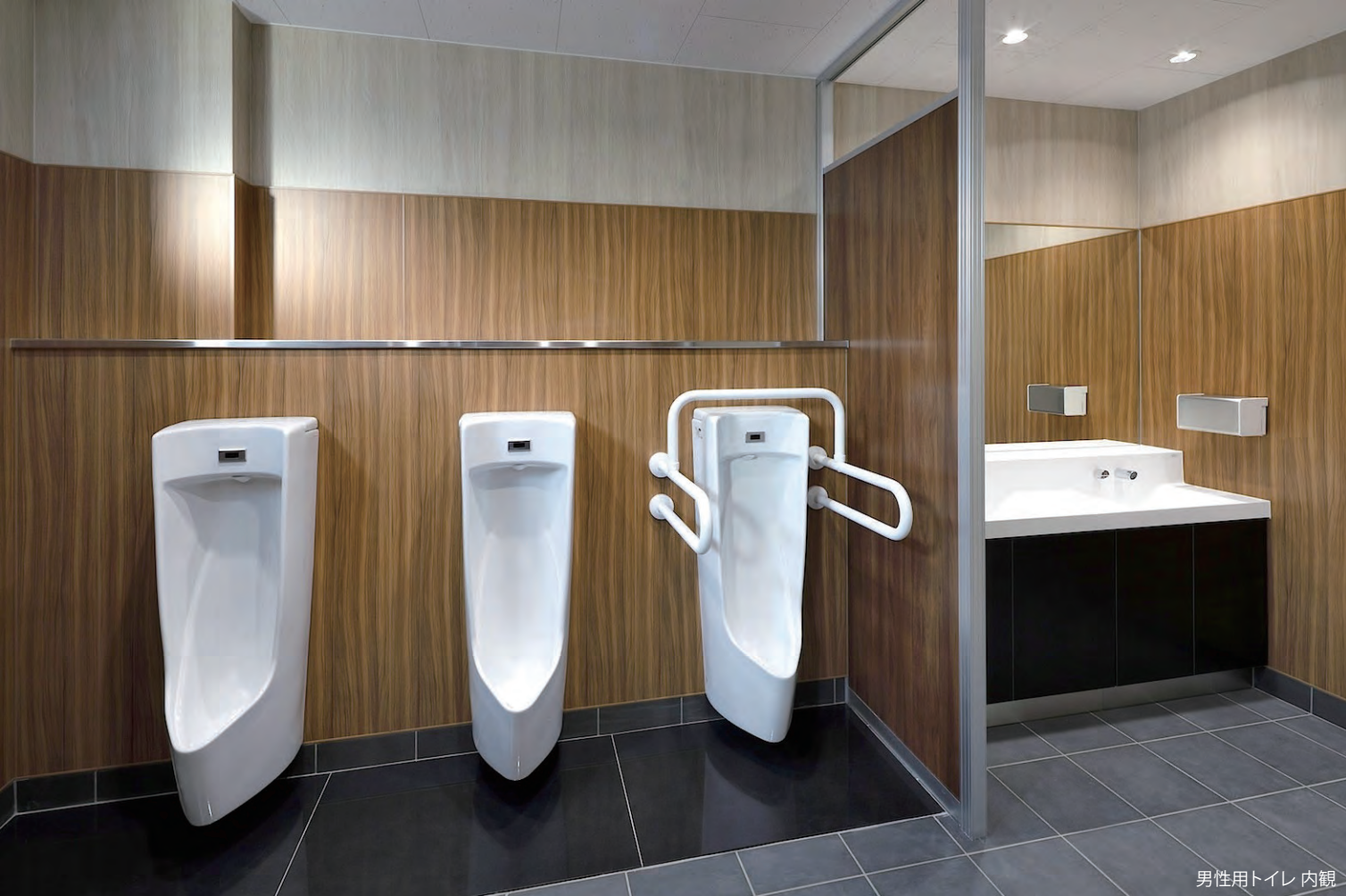
男性用トイレ 内観