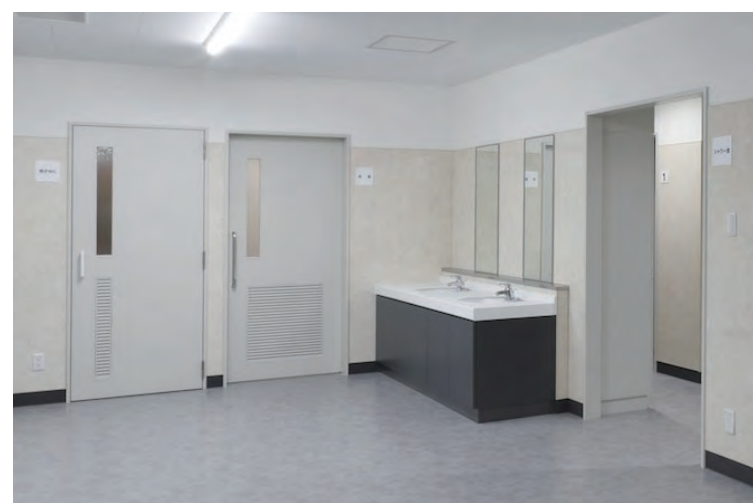
ロッカー室 (浴室・シャワー室・トイレ入り口まわり)

浴室・シャワー室・トイレを備えたロッカー室。室内にも洗面カウンターを設置しているので、トイレの外で歯磨きや手洗いができ便利。