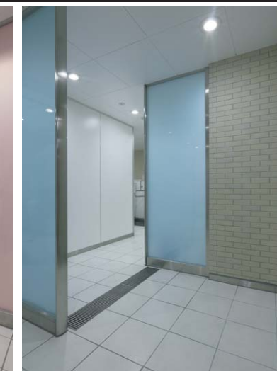
男子トイレ入口まわり