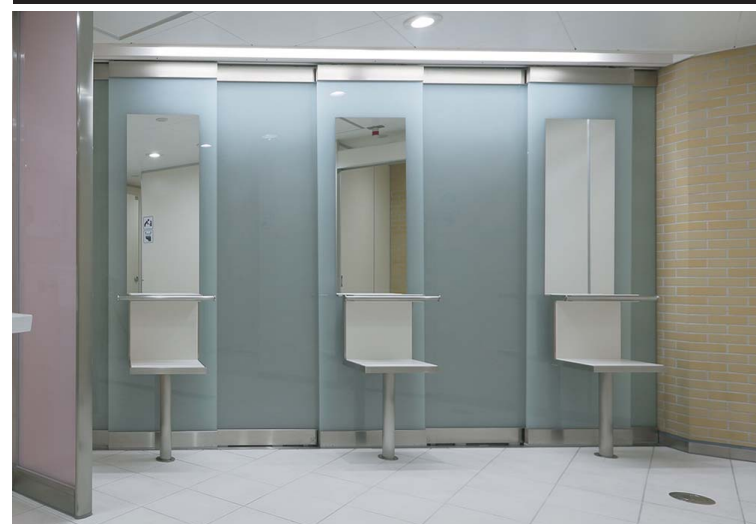
女子トイレパウダーコーナー