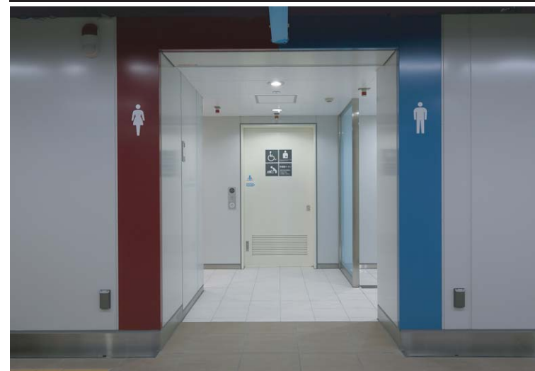
女子・男子・多目的トイレ入口