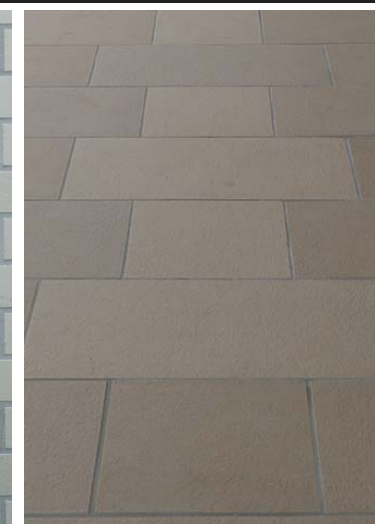
コンコース床面タイル