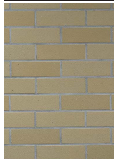
女子トイレ壁面タイル