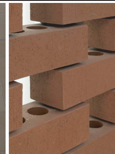
デザインウォール