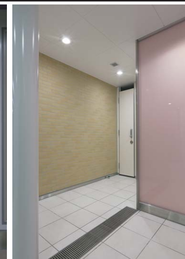
女子トイレ入口まわり