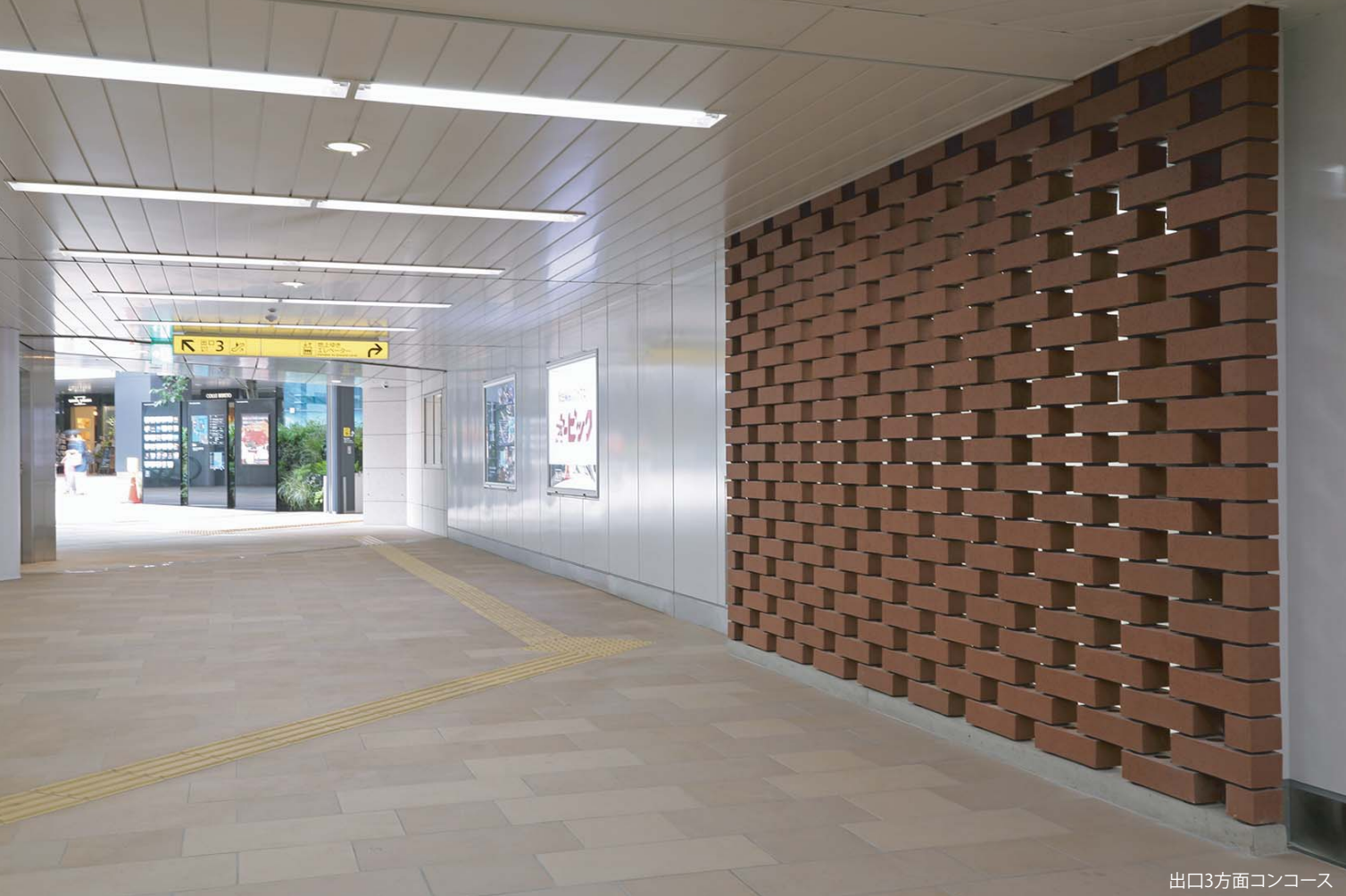
出口3方面コンコース