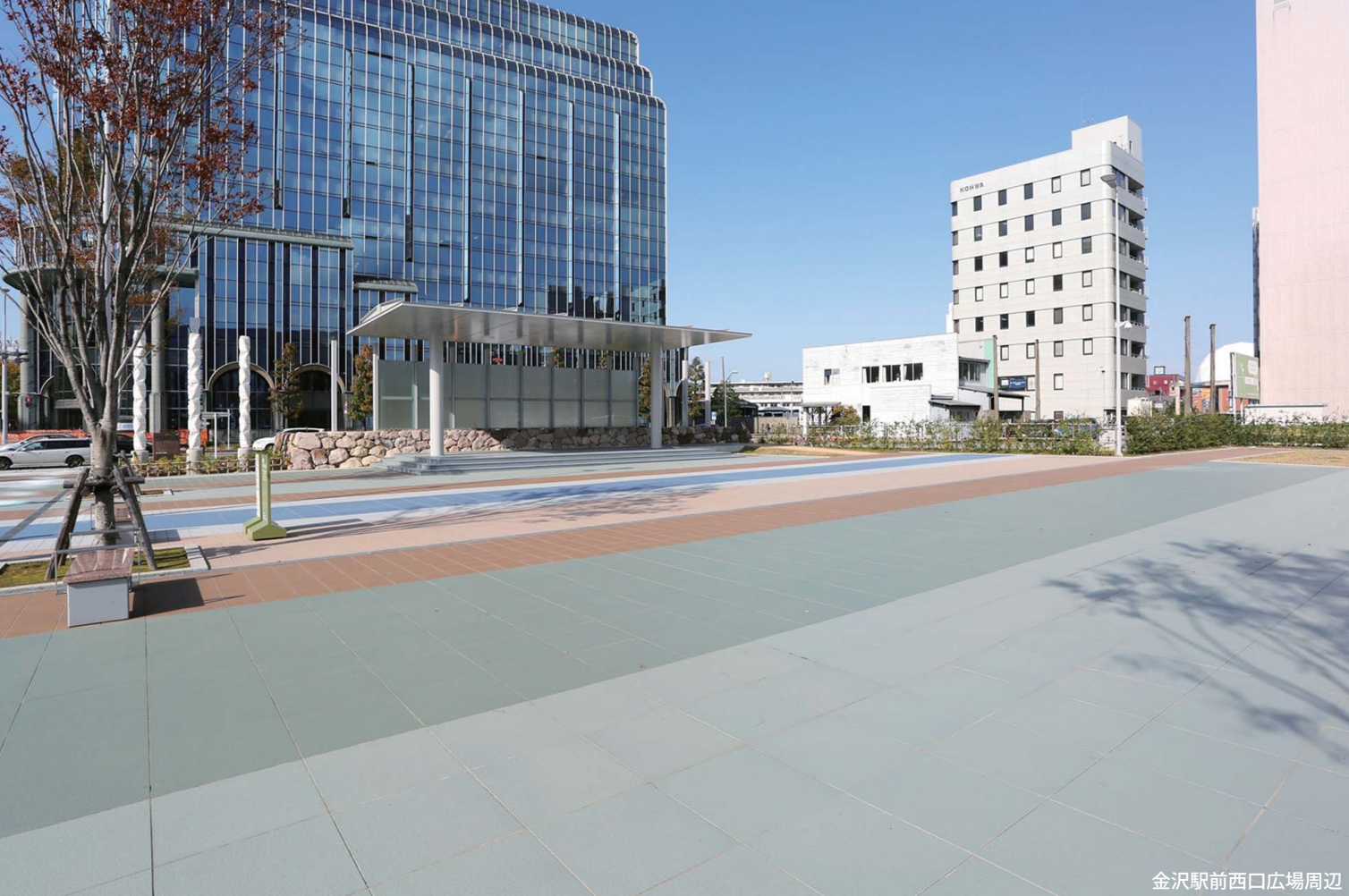
金沢駅前西口広場周辺