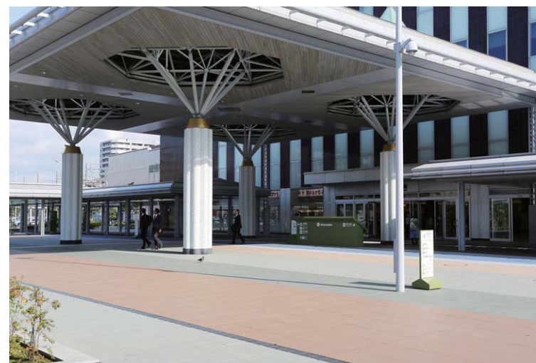
キャノピー(大屋根)