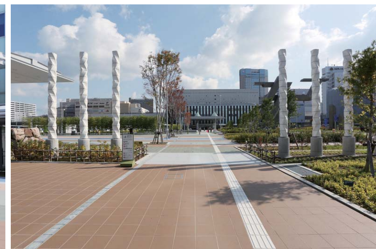
シティーゲートモニュメント