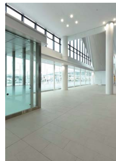
南口1階エントランス