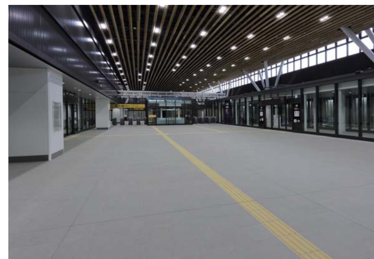
2階改札内コンコース