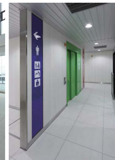
2階改札内トイレアプローチ