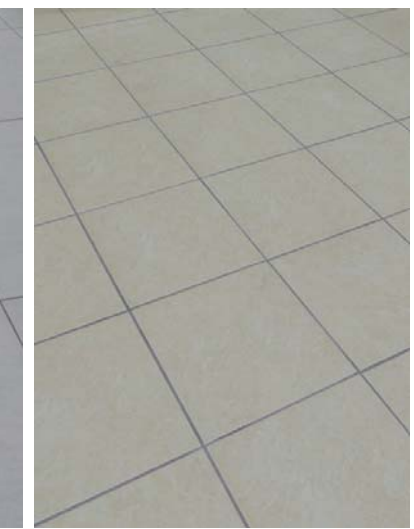
2Fベビー休憩室内床ディテール