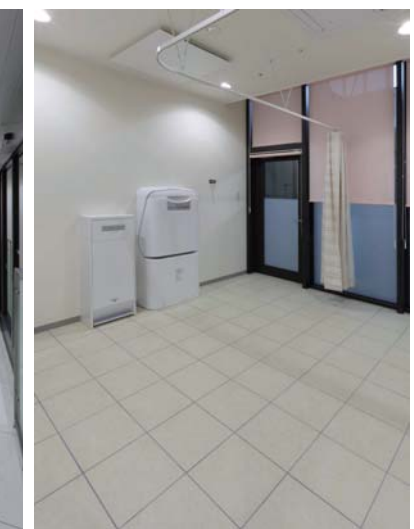
2F待合室内ベビー休憩室