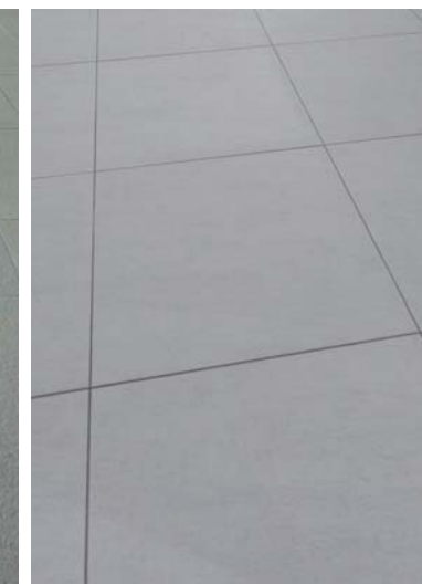
2階改札内トイレ床ディテール