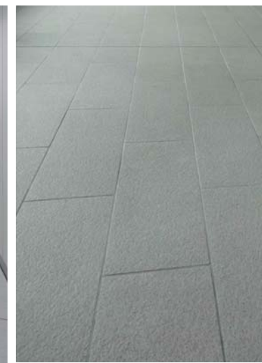
エントランス・コンコース床ディテール