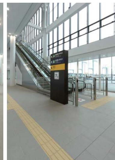
南口1階エスカレーター