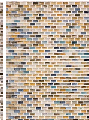
内装壁面ガラスモザイクディテール