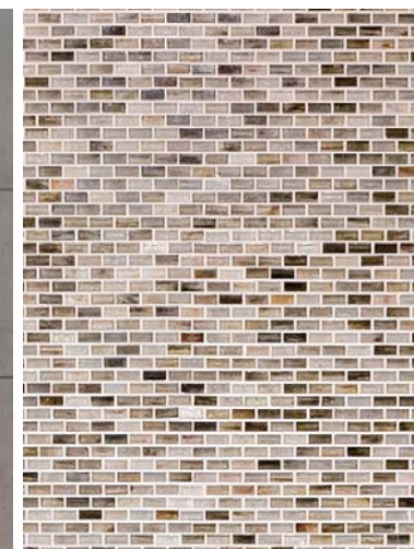
内装壁面ガラスモザイクディテール