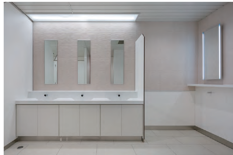
女子トイレ洗面・パウダーコーナー全景