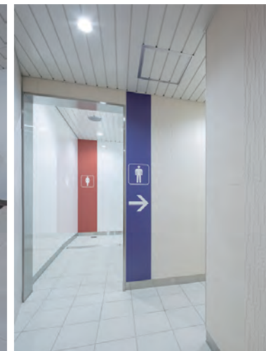
トイレ入口まわり