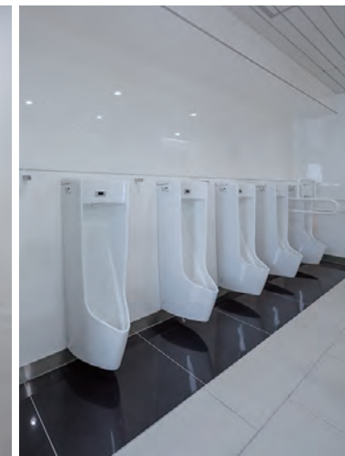
男子トイレ小便器まわり