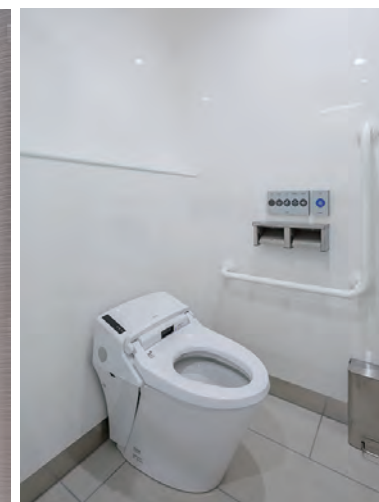
大便ブース内床面