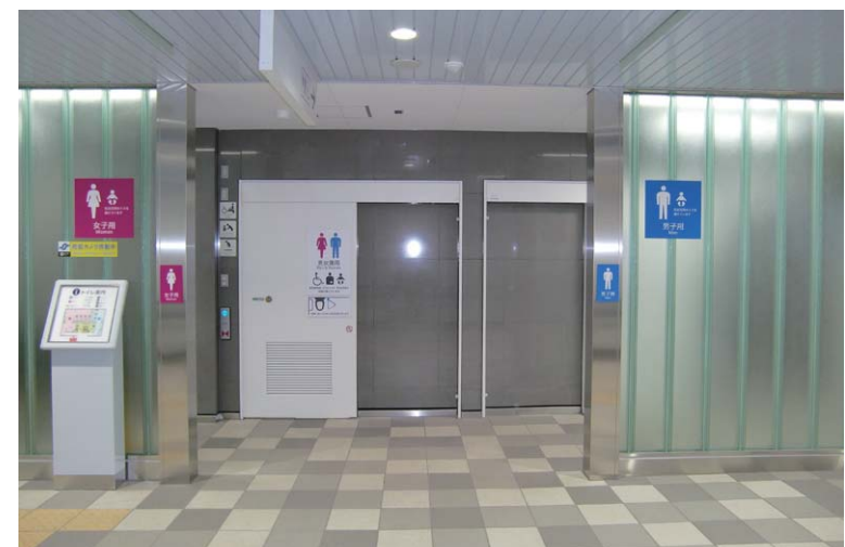
トイレ入り口まわり

閉鎖空間になりがちなトイレへのアプローチには、ガラススクリーンを採用。通路からの直接的な視線をカットしながらも、光を取り込むことができる。