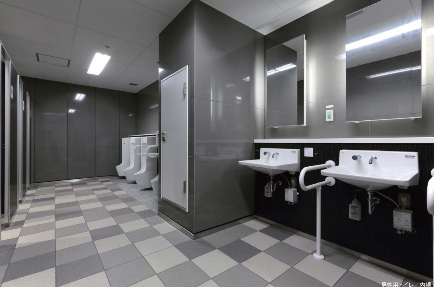
男性用トイレ/内観