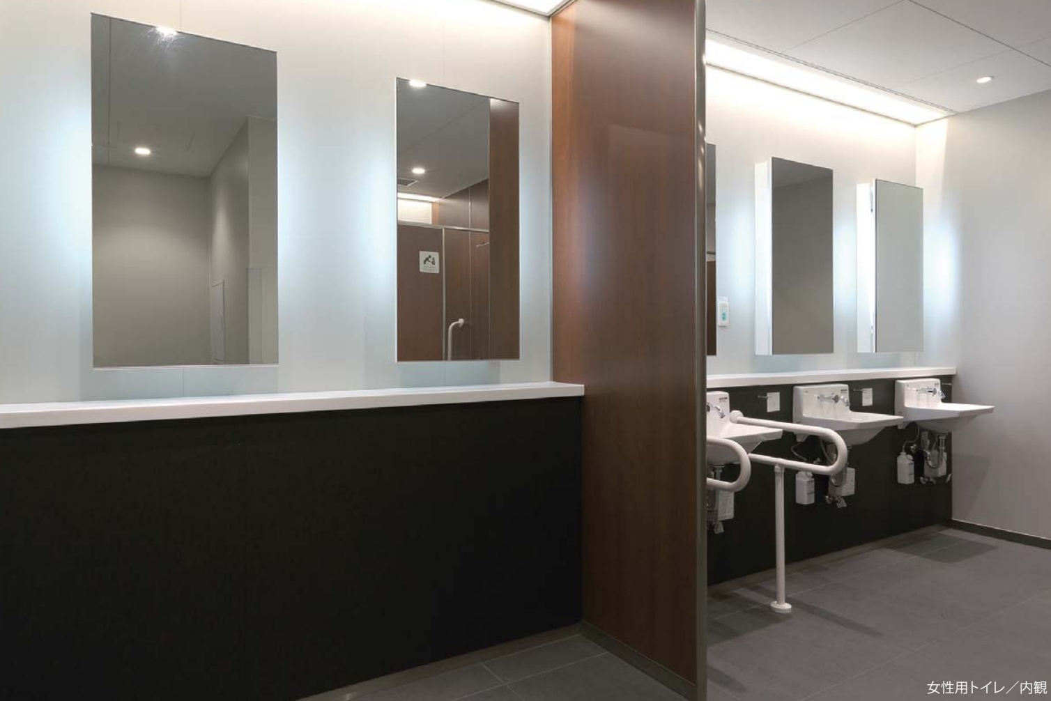
女性用トイレ／内観