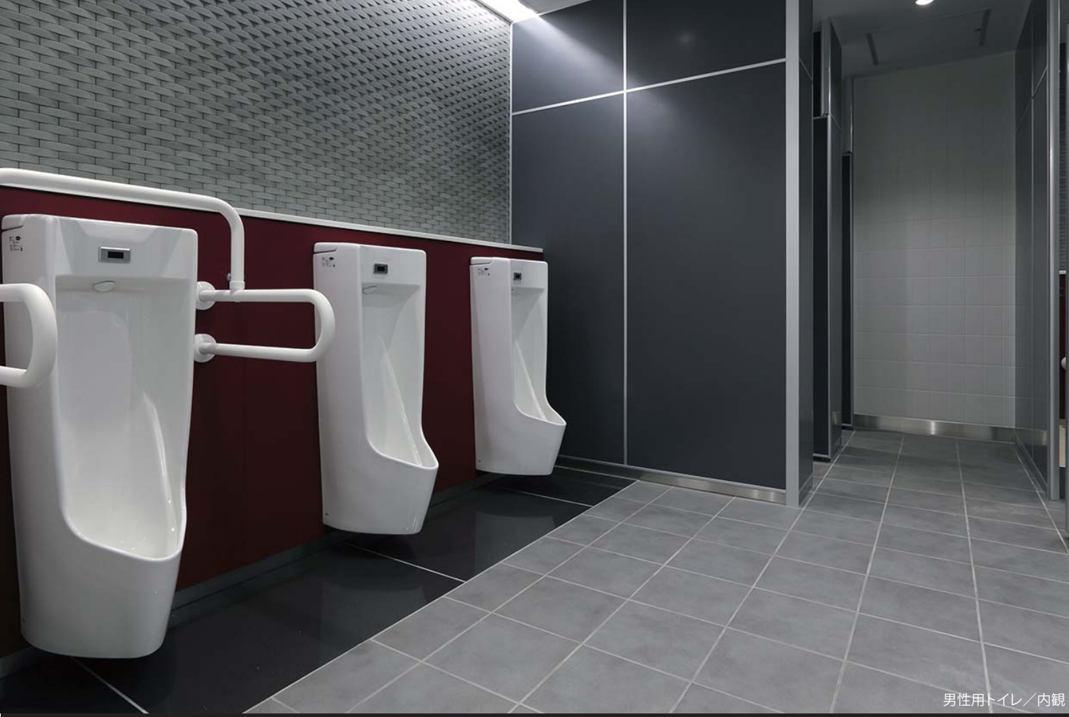
男性用トイレ／内観