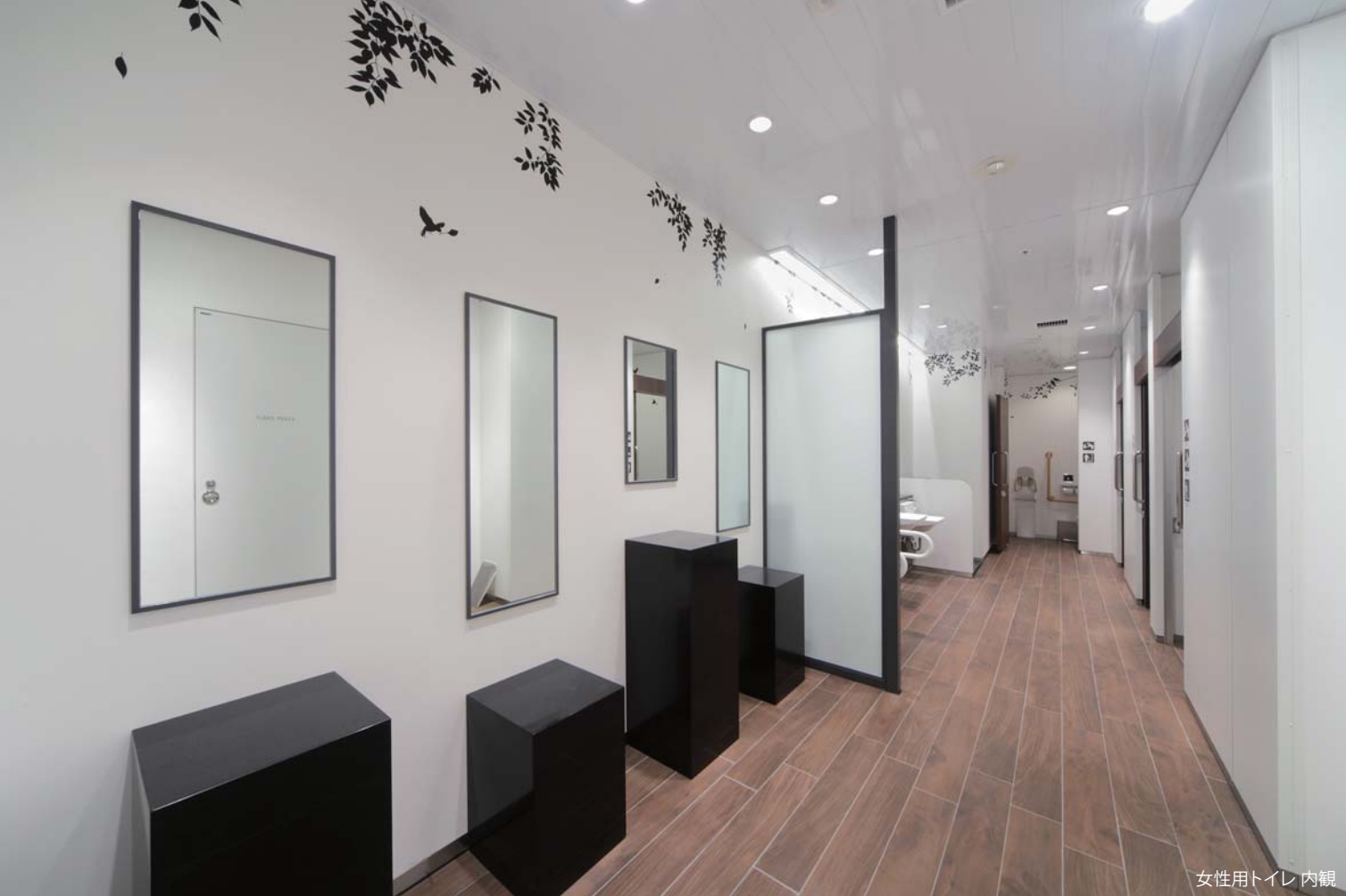
女性用トイレ内観