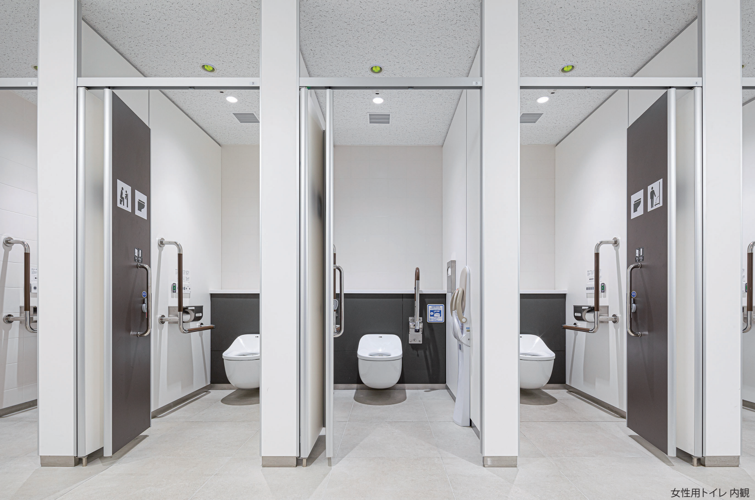
女性用トイレ 内観