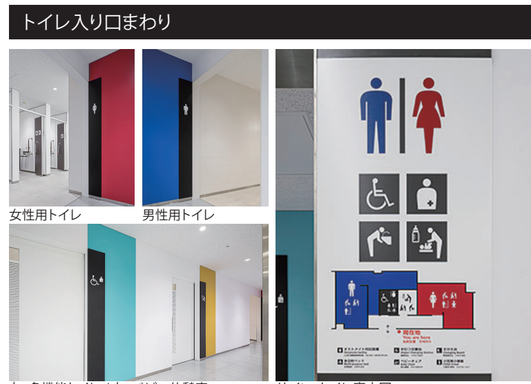
女性用トイレ 男性用トイレ

左:多機能トイレ/右:ベビー休憩室 サイン・トイレ案内図 各施設の入り口は赤・青・水・黄でメリハリをつけて色分け。出入口には室内の設備をピクトサインで表示したトイレ案内図を設置している。