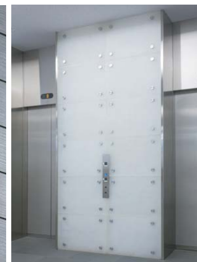
1Fエレベーターホール