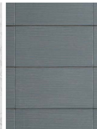
外壁タイル/ディテールアップ