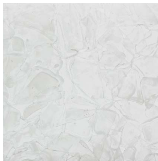
エレベーターホール/タイルディテールアップ