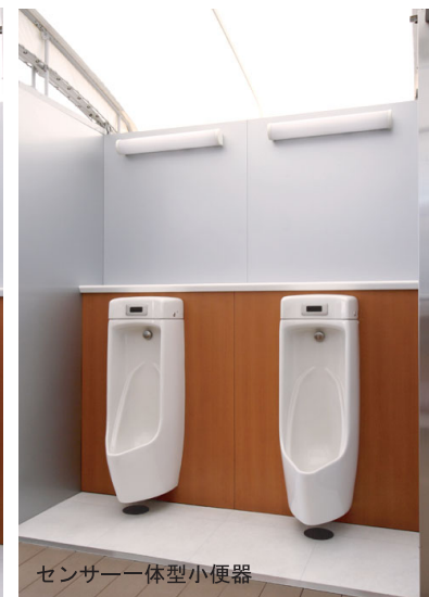
センサー一体型小便器

男性用トイレは2箇所あり、一方にカートリッジ式小便器(無水小便器)、もう一方にはセンサー一体型小便器が設置されている。