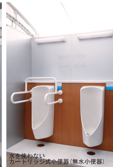
水を使わないカートリッジ式小便器(無水小便器)