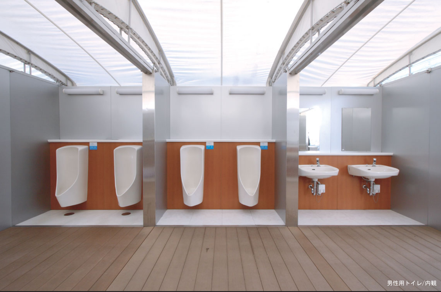
男性用トイレ/内観