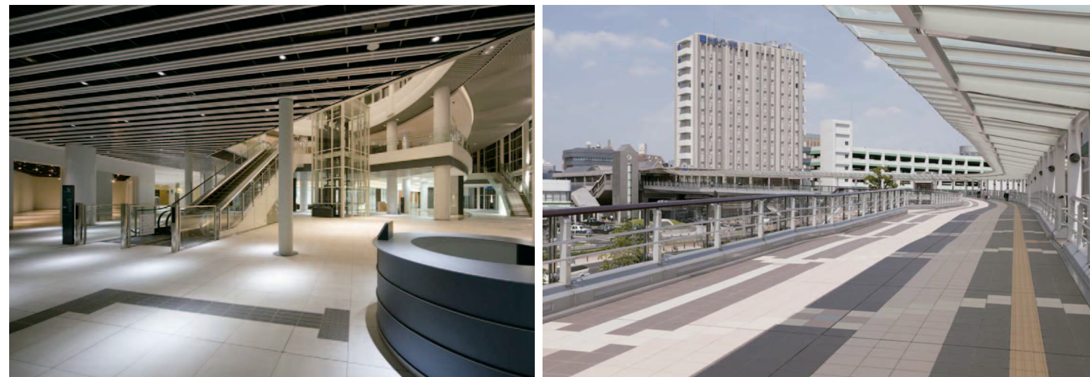
エントランス入口