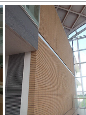
ラウンジ空間より東側を見る