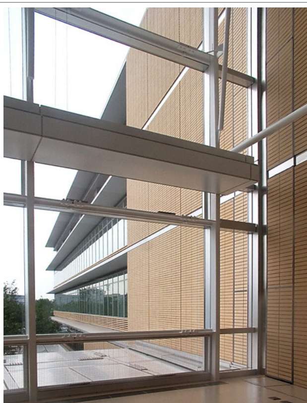
ラウンジ空間より西側を見る