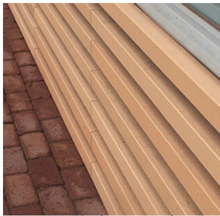
テラコッタルーバーディテールアップ