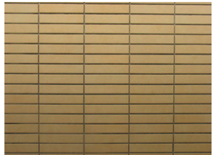
湿式特注タイルディテールアップ