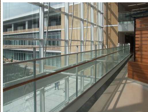
ドーム状の吹き抜け空間2