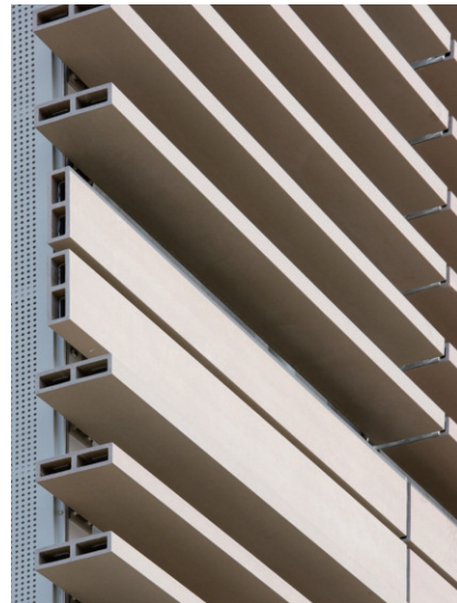
北西側ルーバーディテール