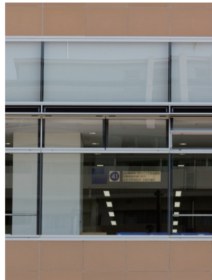
北側タイルディテール