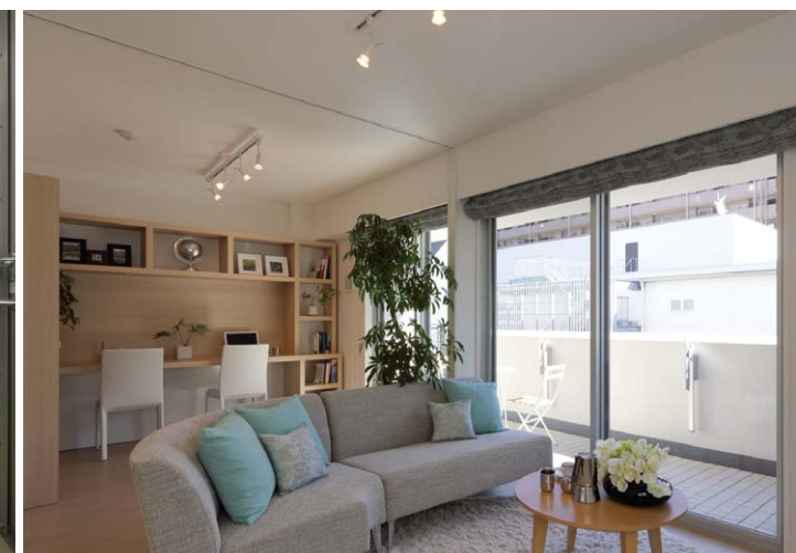
リビングダイニング+洋室(ウォールドア開放時)