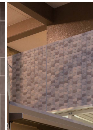
非難通路から外壁を見る