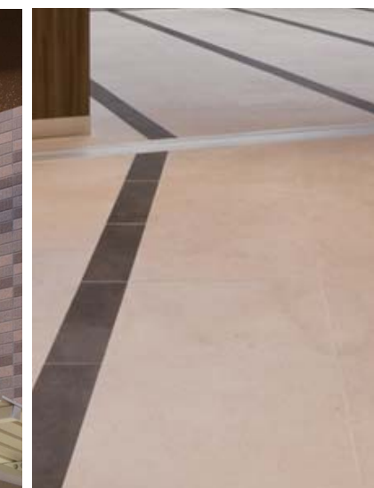
エレベーターホール床