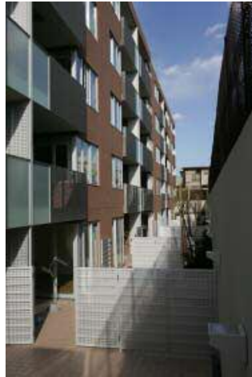
南側1階中庭を見る