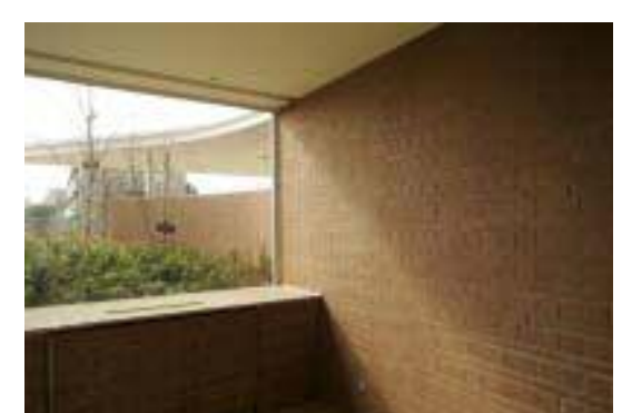
エントランスラウンジより西側エントランスを見る