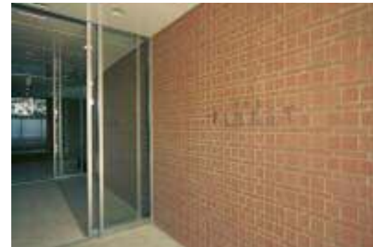
西側エントランス