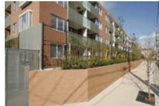
南西街路側：外壁と同じタイルを植栽樹に使用