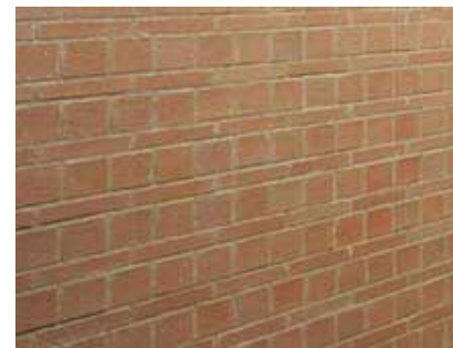
外壁タイルディテールアップ