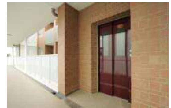
エレベータまわり