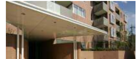
西側ファサード入口とキャノピー