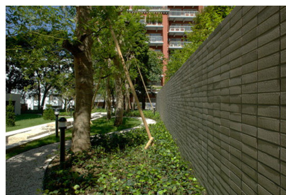
中庭の散策路と塀