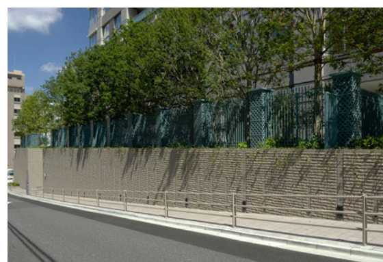
街路に隣接する敷地内の擁壁