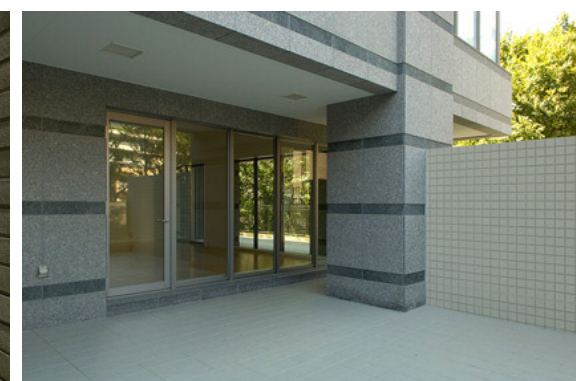
1階住居テラスの壁・床