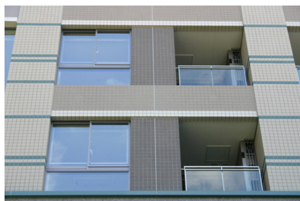
北側下側より見上げる