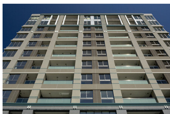
南側外壁を見上げる