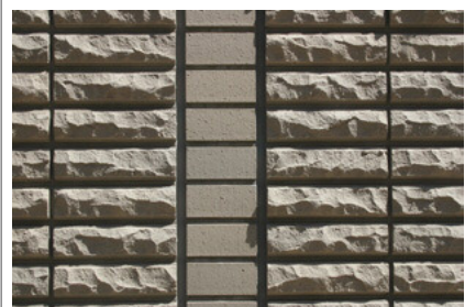
フラットとハツリ面のディテール