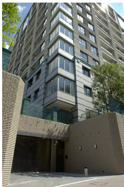
駐車場の入口の擁壁部