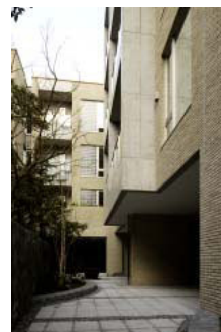
中庭側から建物見上げ