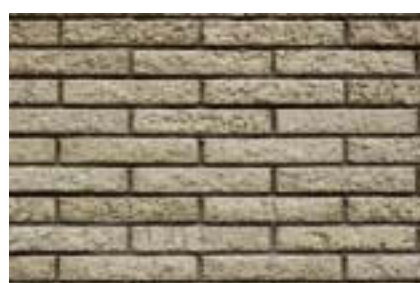
外観ディテールアップ