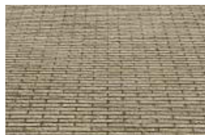
ディテールアップ