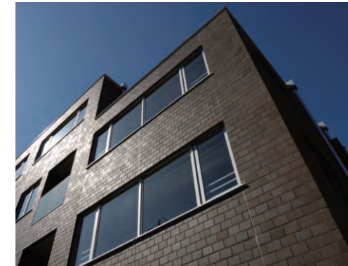
北東側上層部見上げ