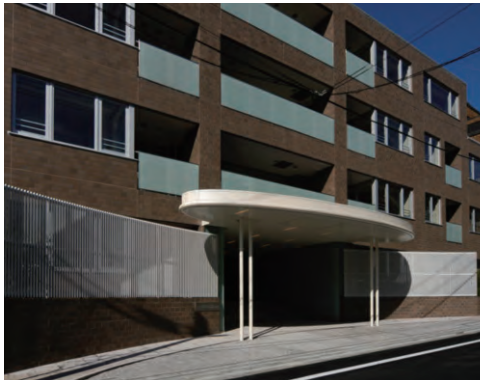
南東側エントランス入口