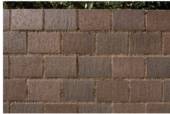
タイルディテール