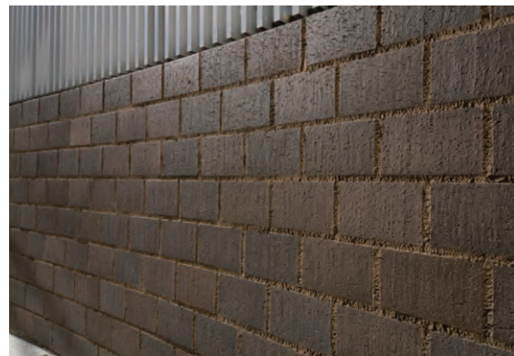
タイルディテール