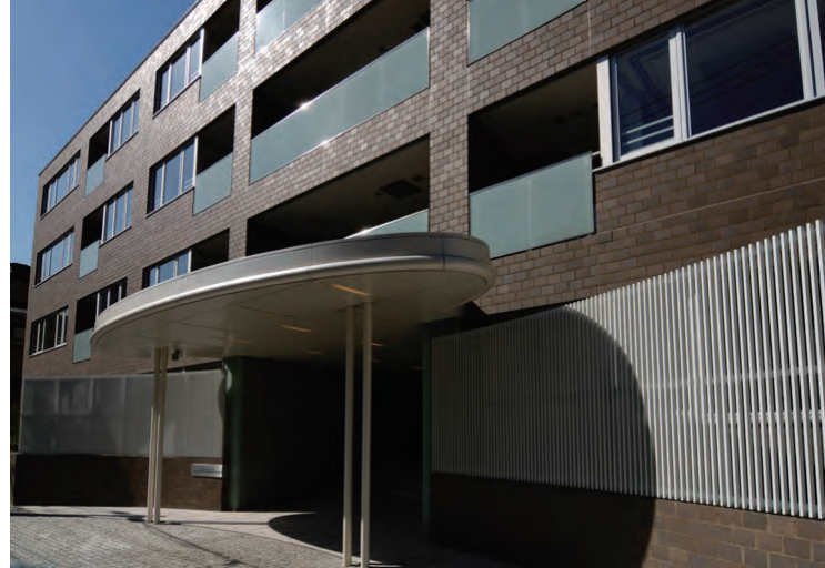
北東側エントランス入口