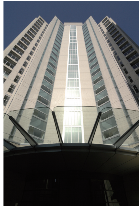
南側エントランス見上げ