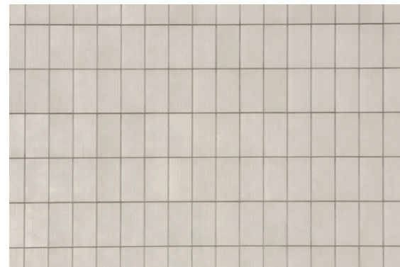
タイルディテール