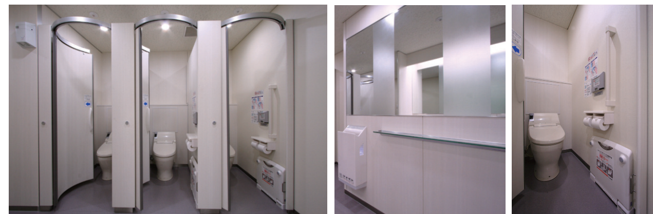
大便器ブースまわり