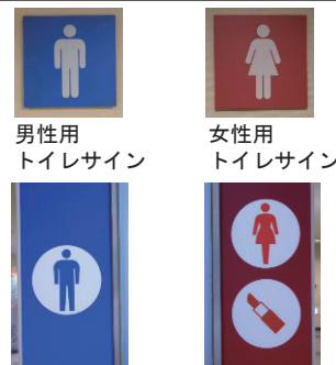
男性用 トイレサイン