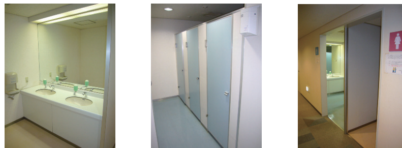
洗面カウンターまわり