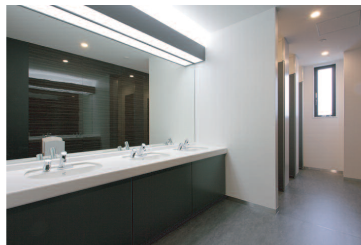
内観 / 洗面カウンター