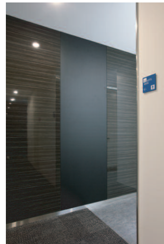
トイレ入り口 / サイン