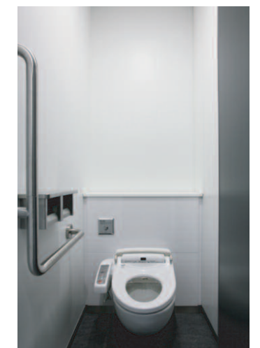
大便器ブース (かんたん箱) / 手すり