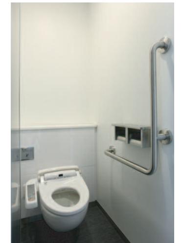
大便器ブース (かんたん箱) / 手すり