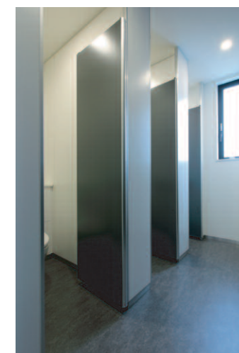
大便器ブースまわり