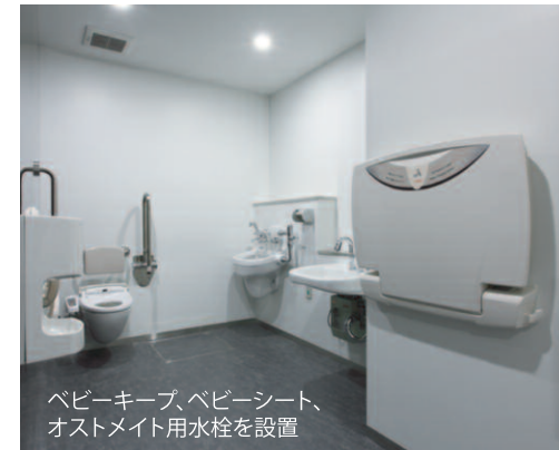
1階多目的トイレ / 内観