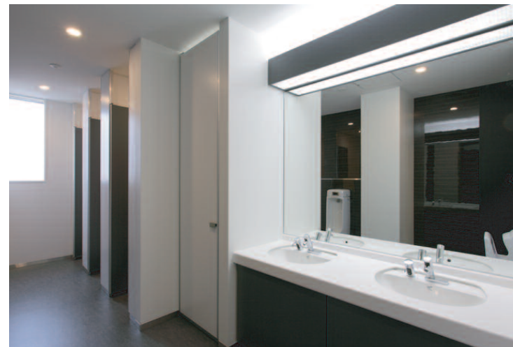
内観 / 洗面カウンター