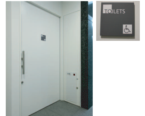
トイレ入り口 / サイン