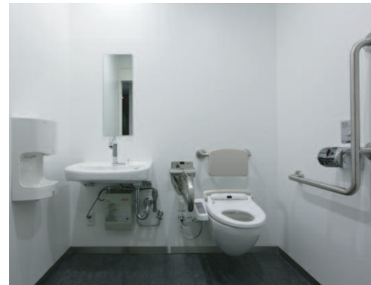
基準階多目的トイレ / 内観