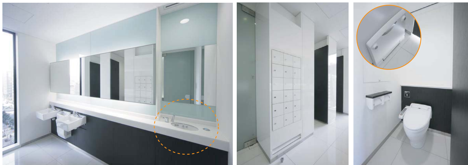
女性用トイレは洗面コーナーの横にパウダーコーナーと歯磨きスペースを確保。歯磨きコーナーには専用の水栓を設置した。そのほかにも、壁面にはミニロッカーを設置、大便ブースの1ヵ所にはストッキングの交換などができるチェンジングボードを設置するなど、女性オフィスワーカーに配慮がされている。