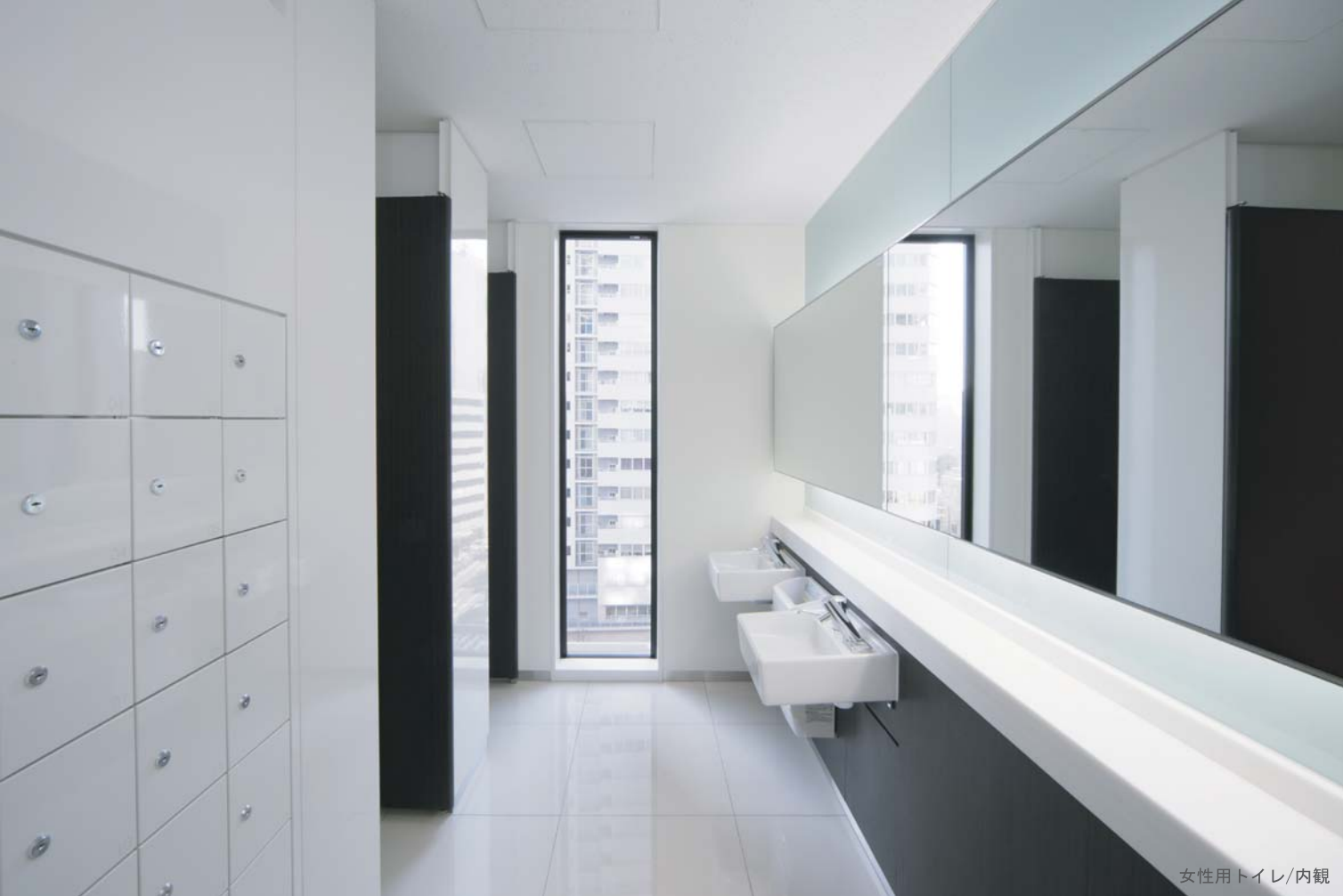
女性用トイレ/内観