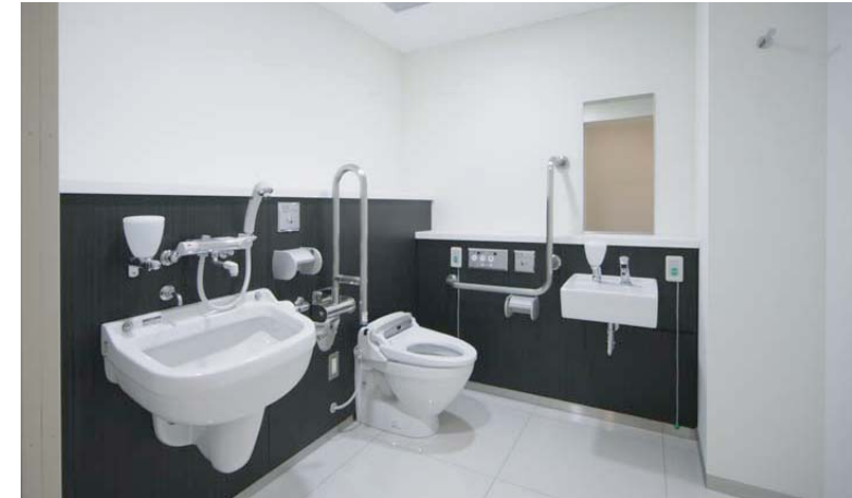
1階にはオストメイト用水栓のついた多目的トイレを設置。