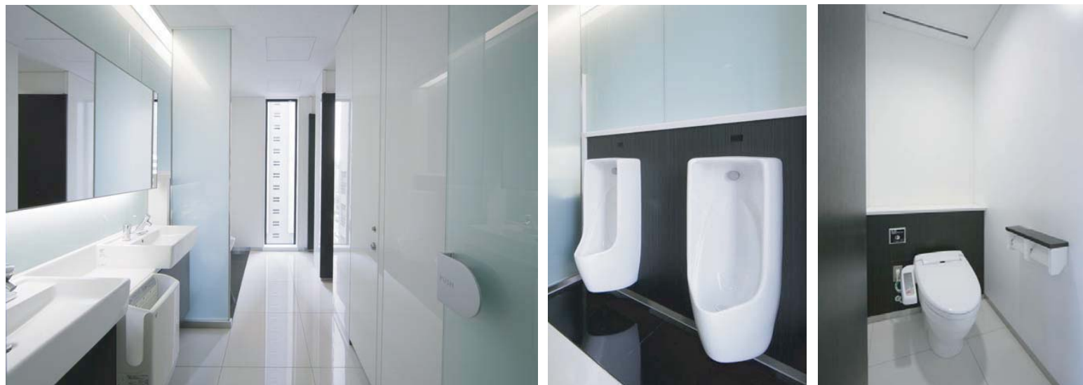
開口部を広くとり、自然光が入る明るいトイレ空間となっている。大便器は男女ともに洗浄水量6ℓの節水型大便器を採用し、省エネに配慮している。