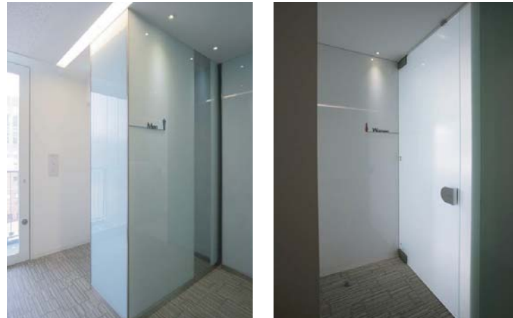
左が男性用トイレ入り口。右が女性用トイレ入り口。