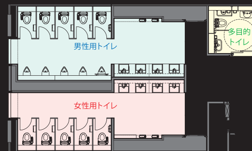
基準階トイレ 平面図