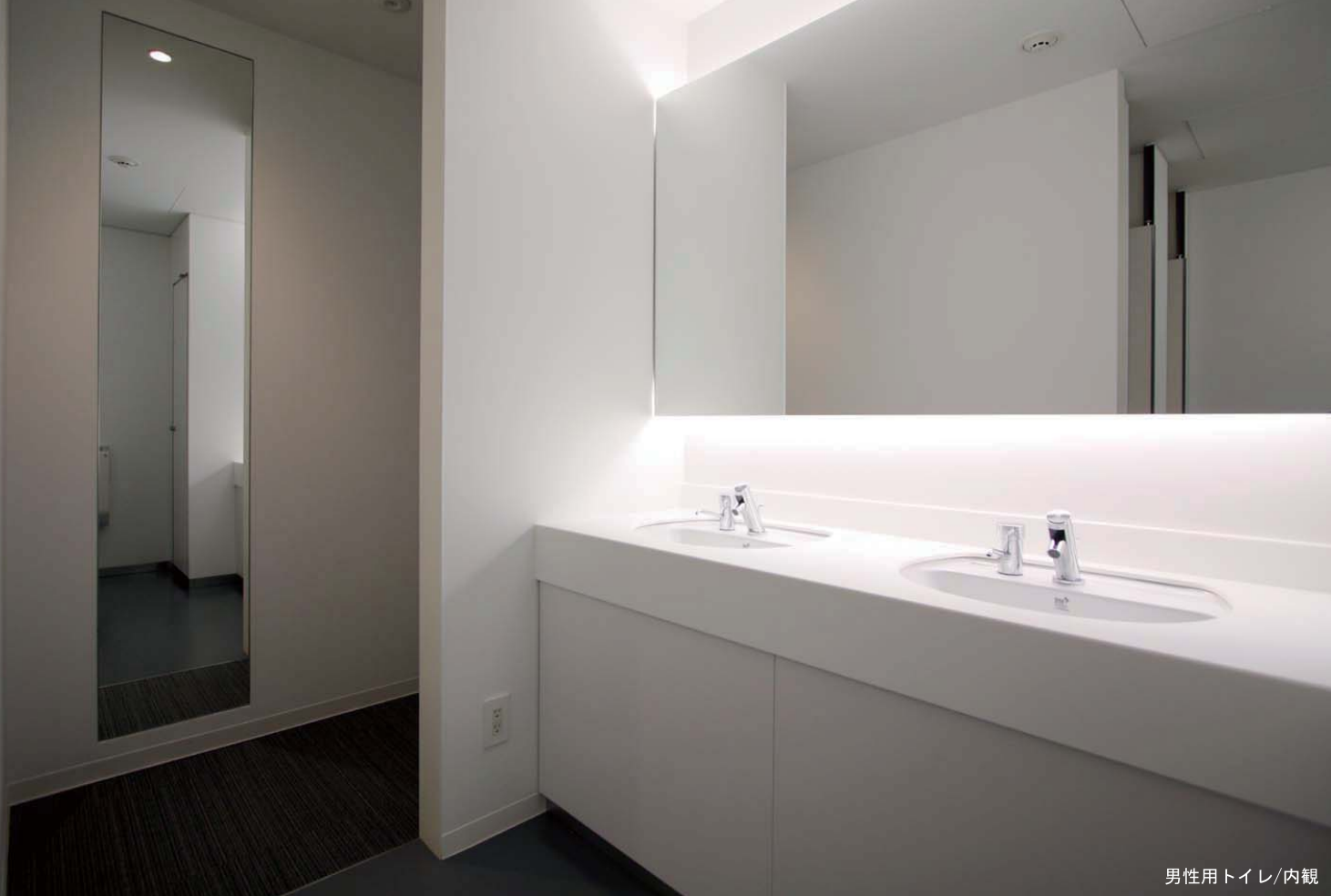
男性用トイレ/内観