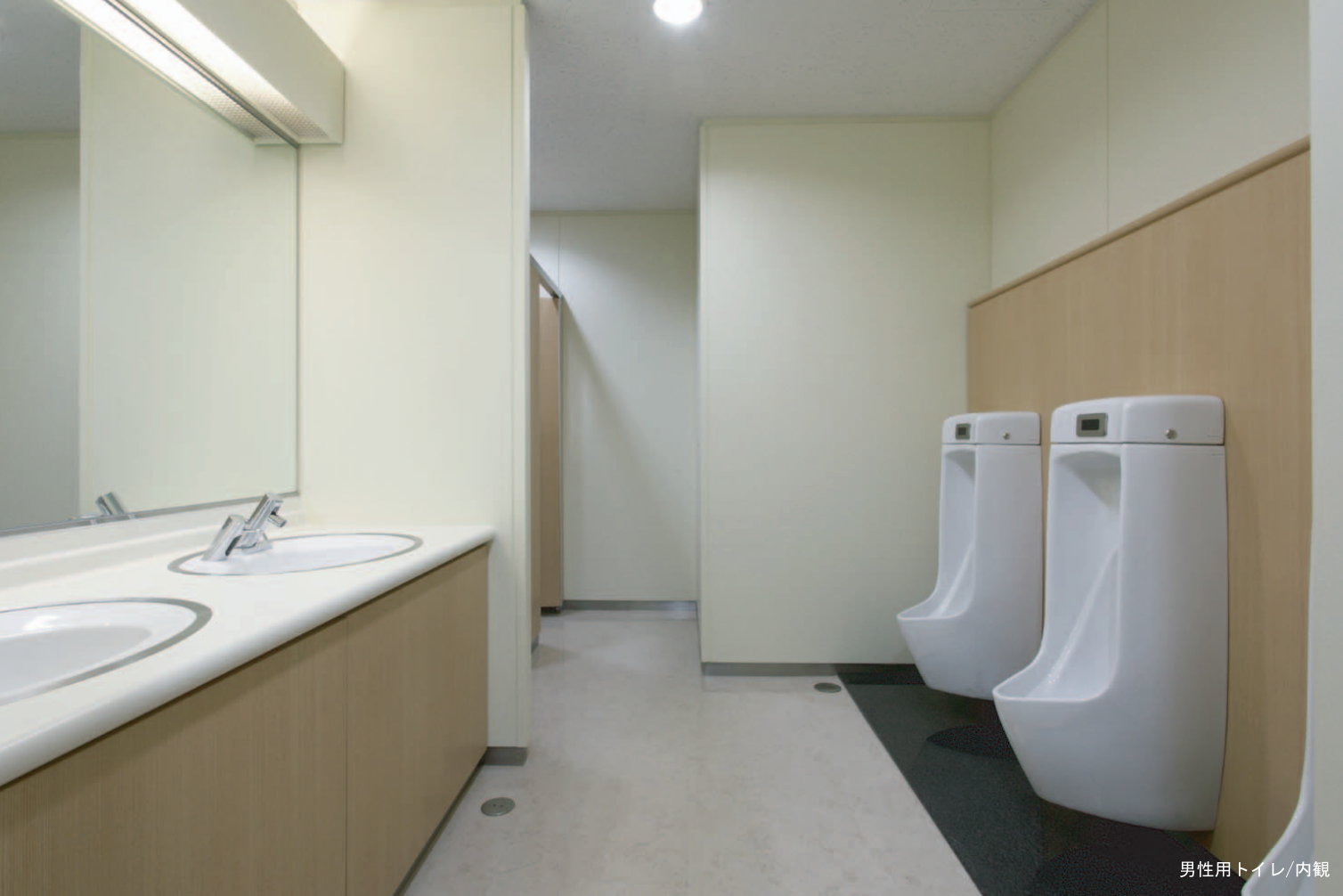
男性用トイレ/内観