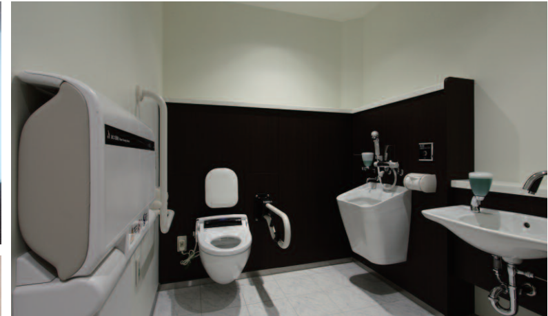
1Fには汚物流し・ユニバーサルベット等多機能多目的トイレを設置し、様々な利用が出来るよう配慮した。1～13Fの女子トイレには化粧ポーチなどが入れられるミニロッカーを設置