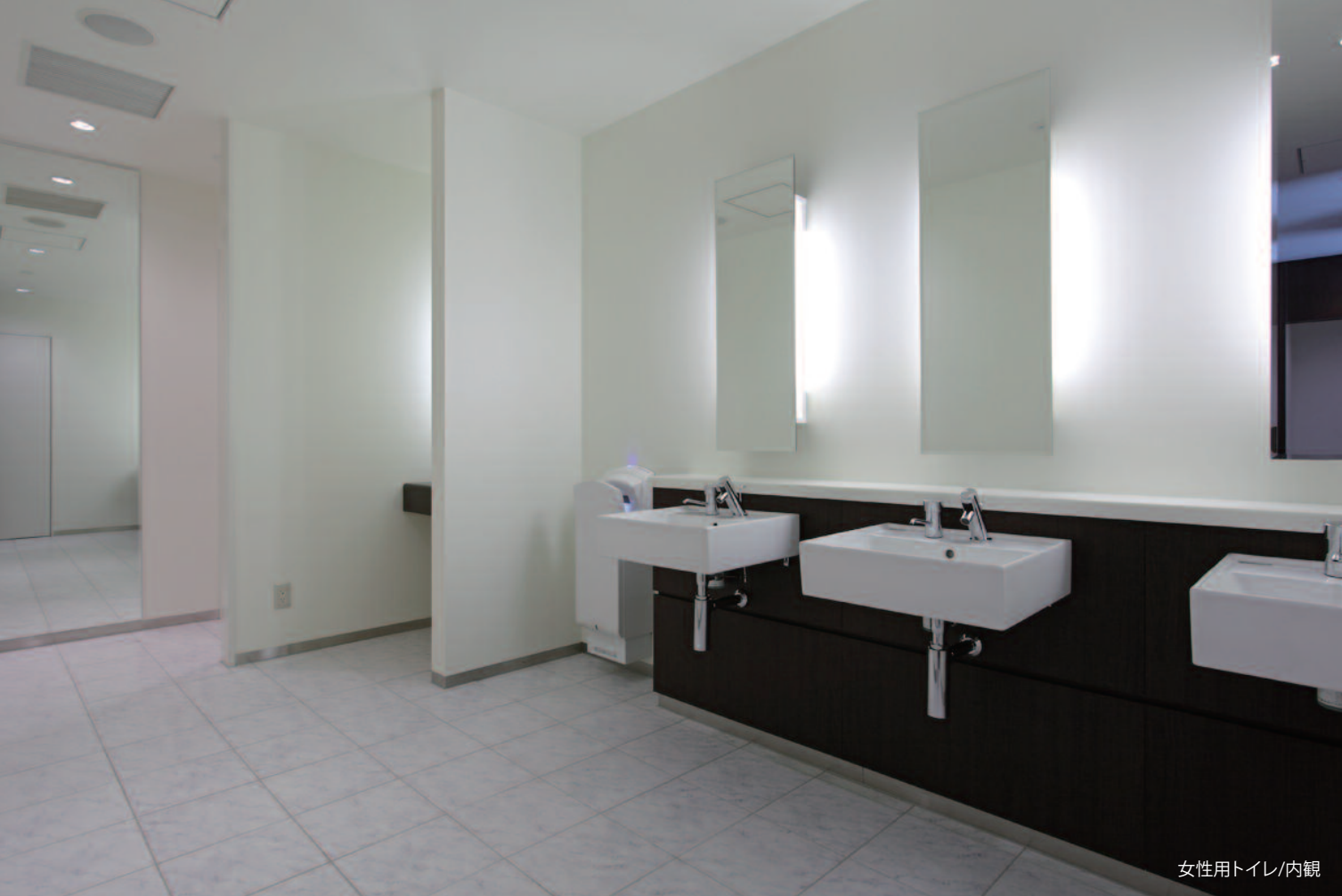
女性用トイレ/内観