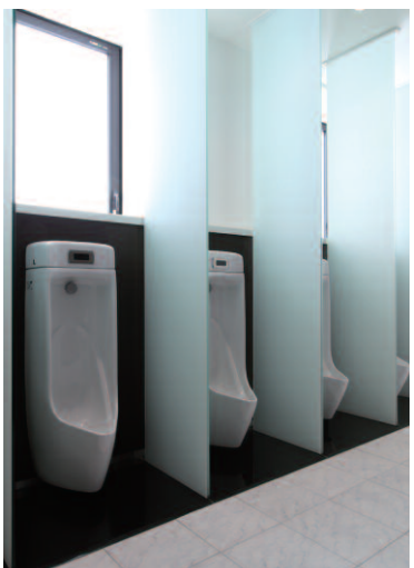
小便器は隣の器具との間に仕切りを設け、プライバシーを確保している。また、自然採光が取り入れられ明るく快適な空間となっている。