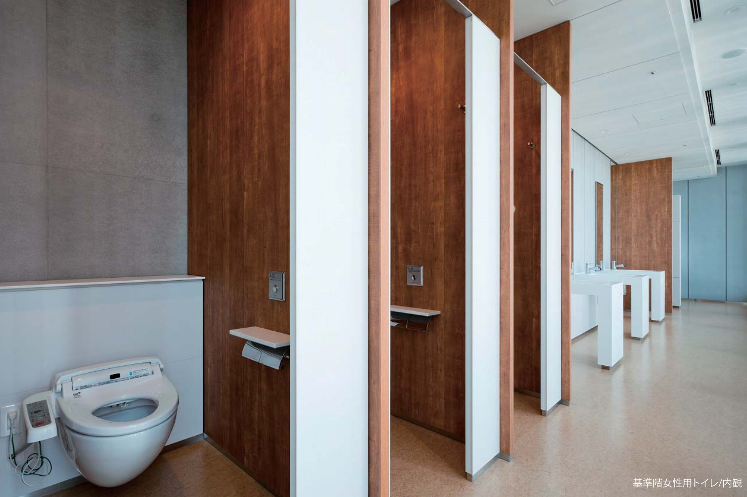
基準階女性用トイレ/内観