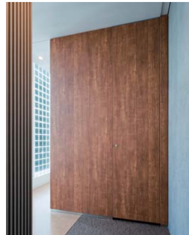
トイレ入口まわり