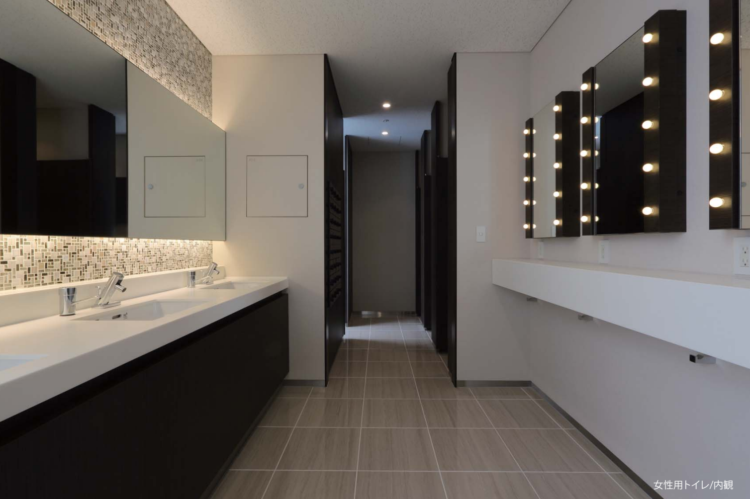
女性用トイレ/内観