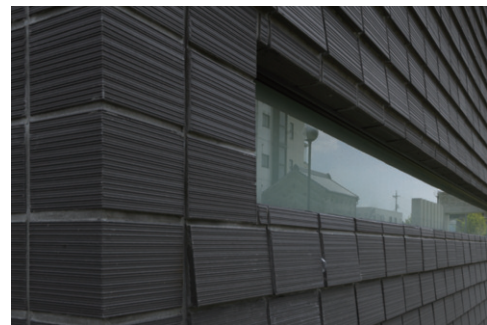
タイルコーナーディテールアップ(開口部)