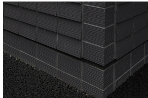
タイルコーナーディテール