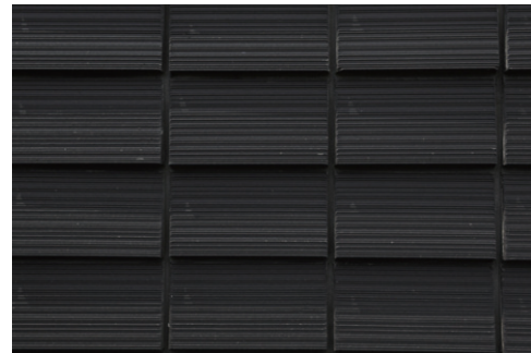
タイルディテールアップ(正面)