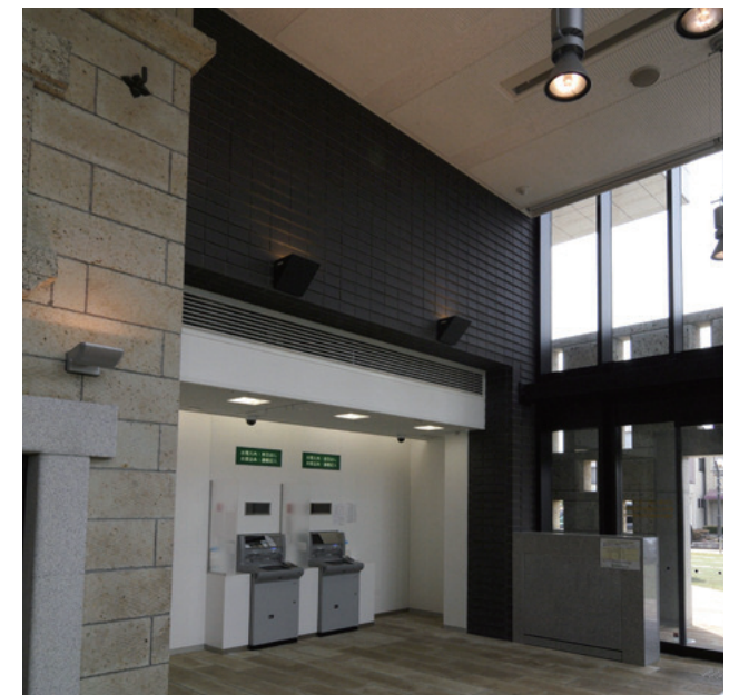
エントランス内観