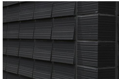
タイルコーナーディテールアップ