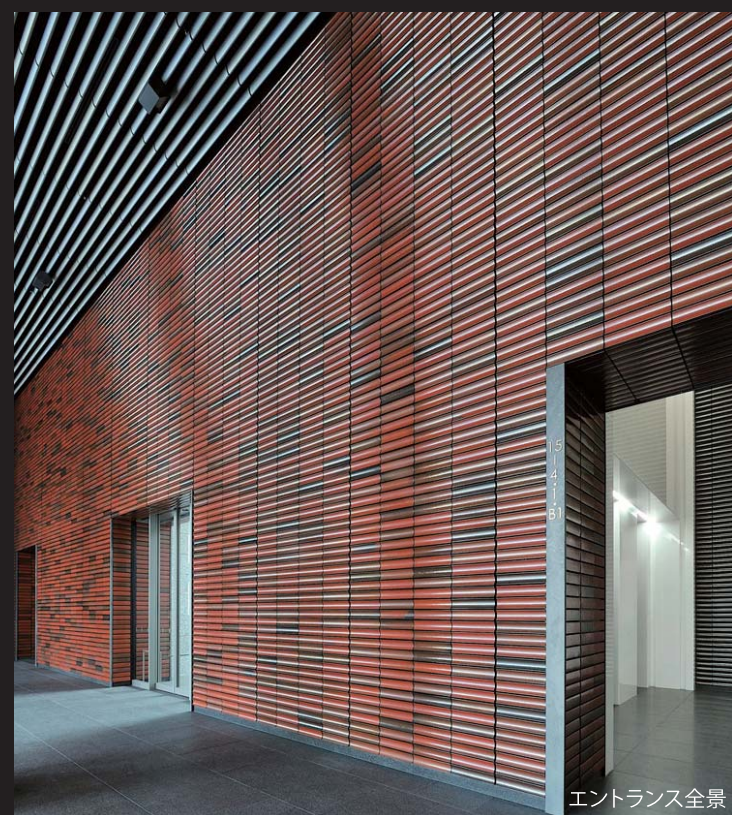
エントランス全景

内装壁タイル【赤】・・・6色MIX OM3116-41-1:-41-2:-42-2:-42-2:-45:-46 =20%:40%:10%:20%:5%:5%MIX 【黒】・・・2色MIX OM3116-43-2:-46=50%:50%MIX DCF-10BNET/CRS-1