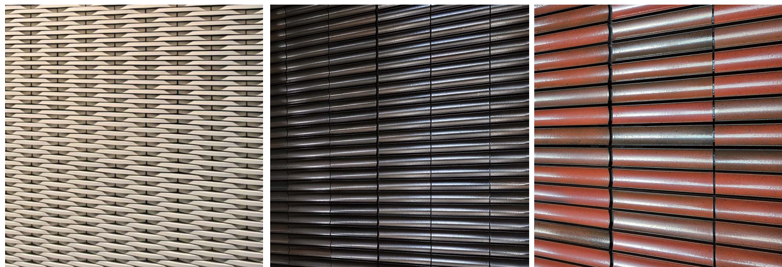
ディテールアップ