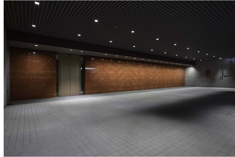
レジデンス車寄せ