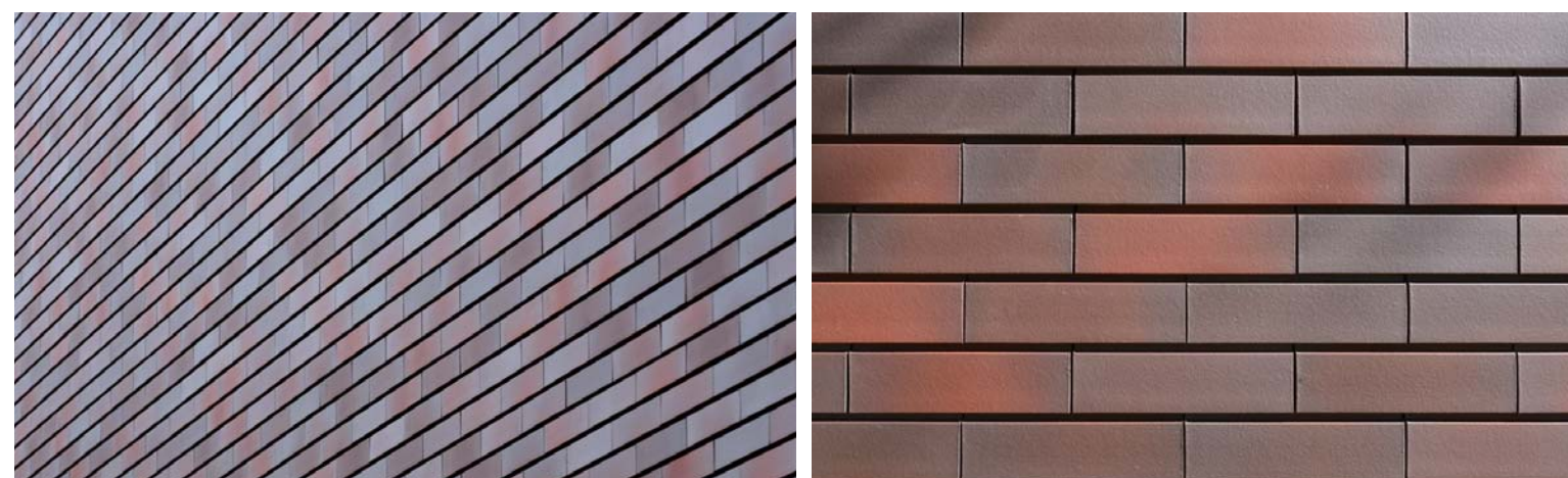
タイルディテール