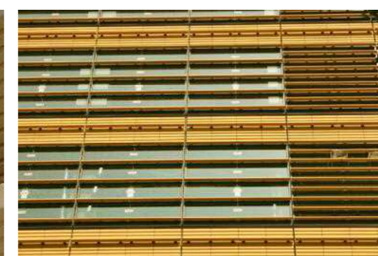
テラコッタディテール