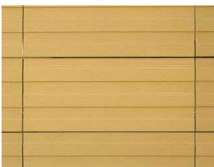
テラコッタルーバーディテールアップ