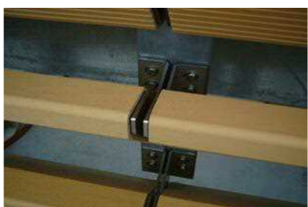
湿式特注タイルディテールアップ