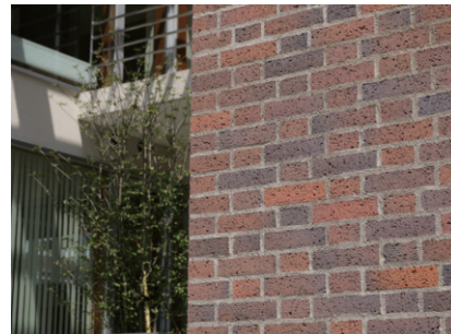
コーナー部ディテールアップ