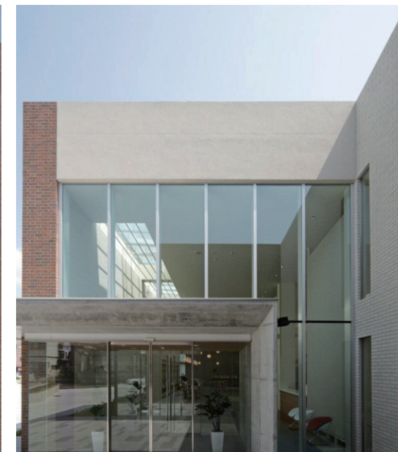
エントランス開口部