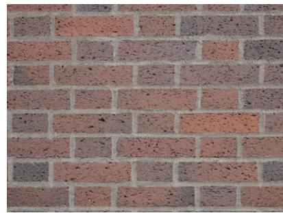
タイルディテールアップ