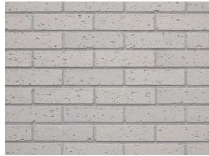
タイルディテールアップ