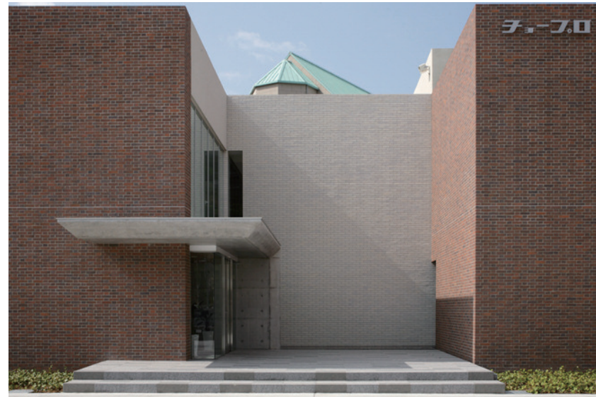
エントランス正面ファサード