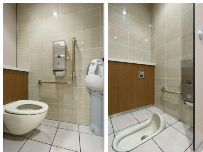
大便器ブース /ベビーキープ