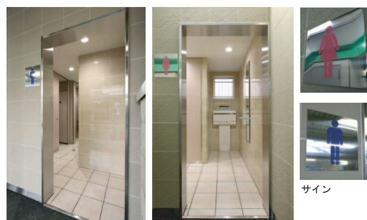
男性用トイレ入り口