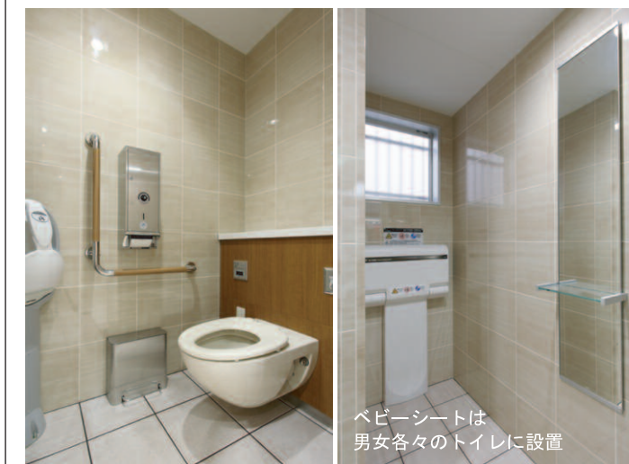
大便器ブース /ベビーキープ