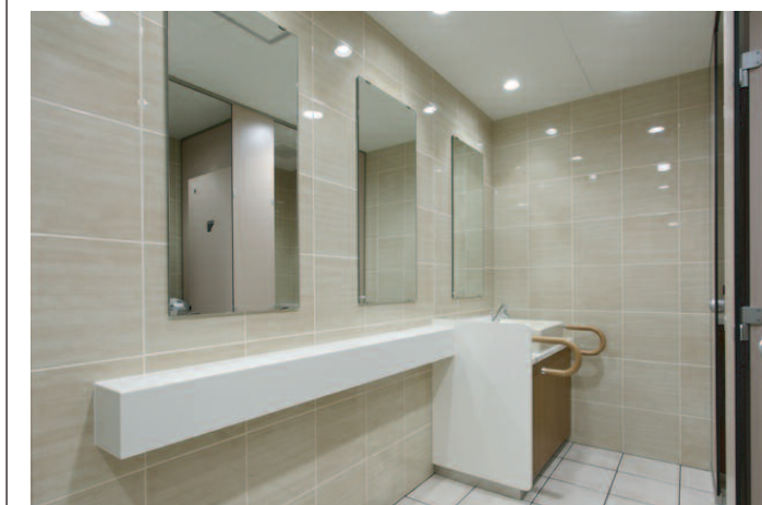
洗面カウンターまわり /パウダーコーナー