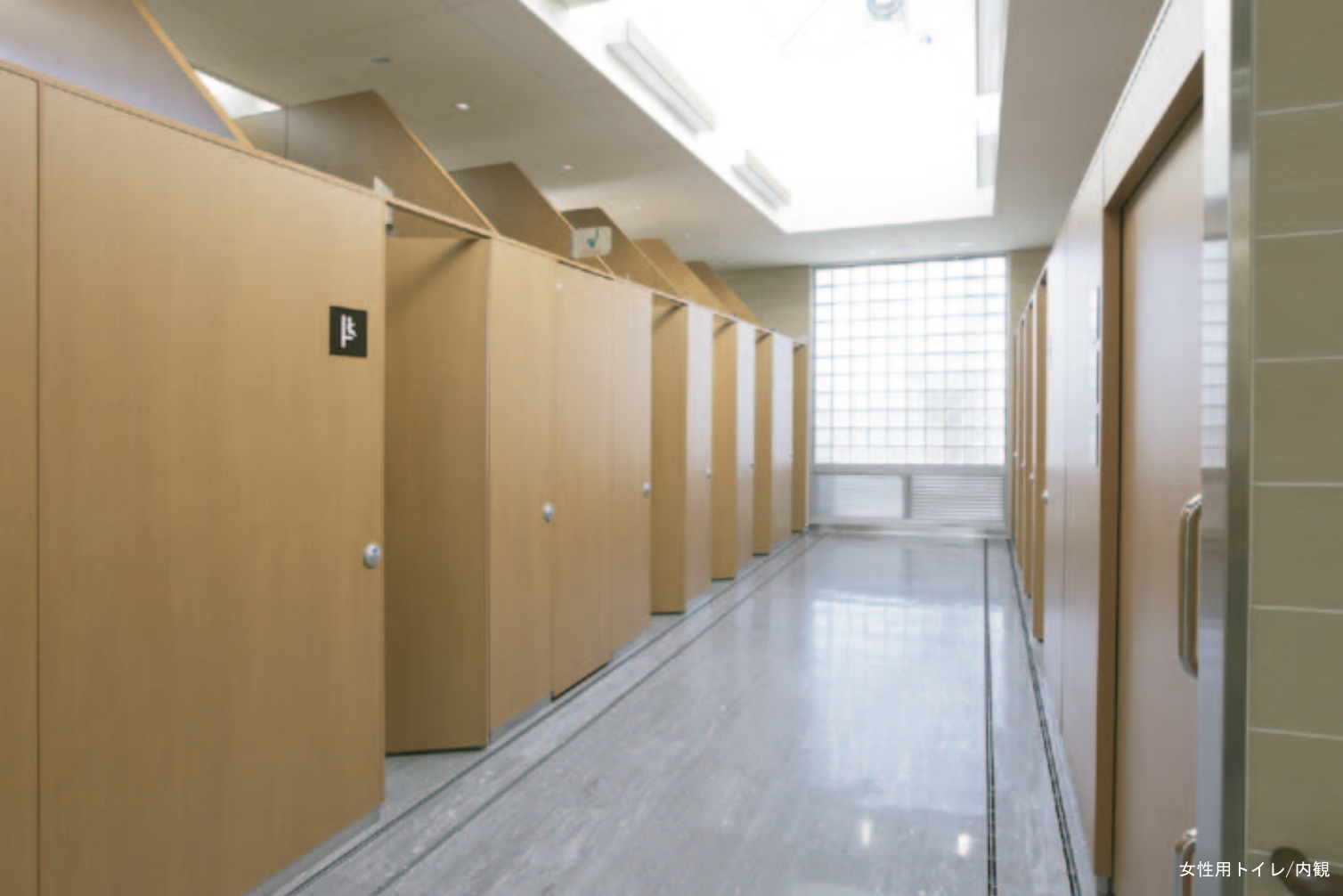
女性用トイレ/内観