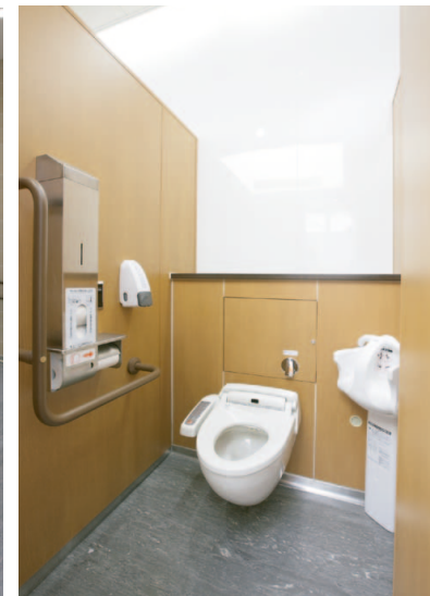
大便器の8割を洋風に変更。新型の壁掛大便器で節水(6ℓ)洗浄機器を採用した。