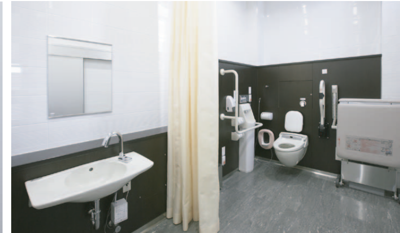
男女トイレとは別に設けられた身障者お手洗いには、カーテンやユニバーサルシートなどを設置。(オストメイト用の設備は男女トイレの大型ブースに設置)