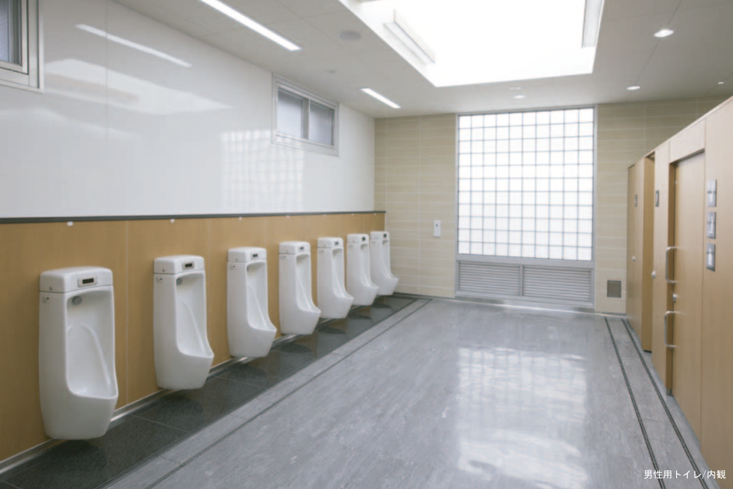
男性用トイレ/内観