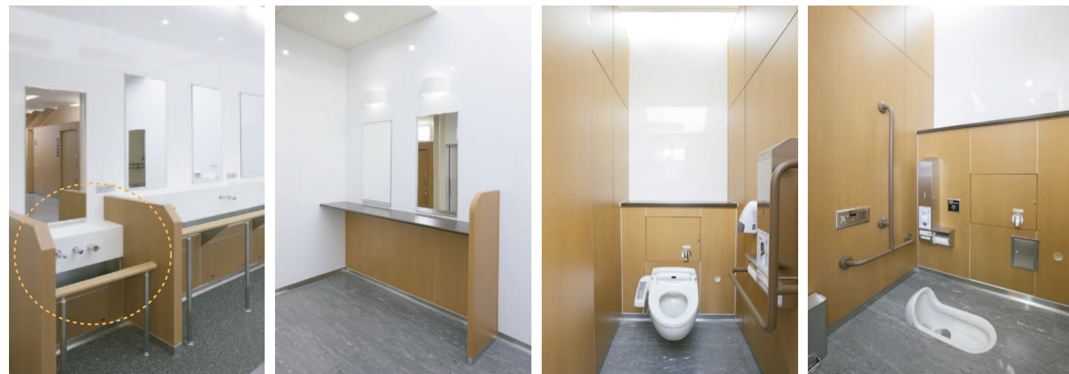
子ども用の小便器や背の低い洗面カウンターを設置し、子ども連れ利用者に配慮。(男性用トイレにも設置)