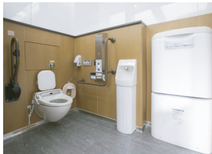
男性用トイレに設置されている「大型ブース」はベビーシート、またはオストメイトの機能が付与されており、多目的に利用できるようになっている。