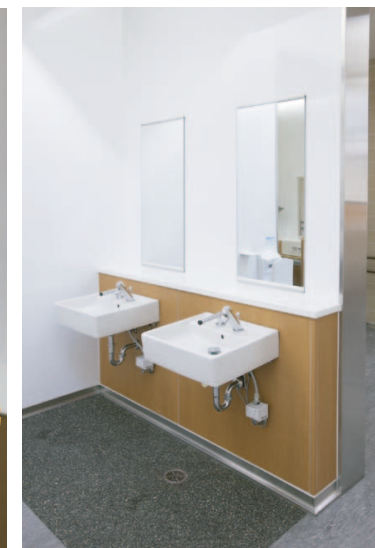
洗顔を目的として、手洗いゾーン以外に大きな鉢の壁掛け洗面器を採用。