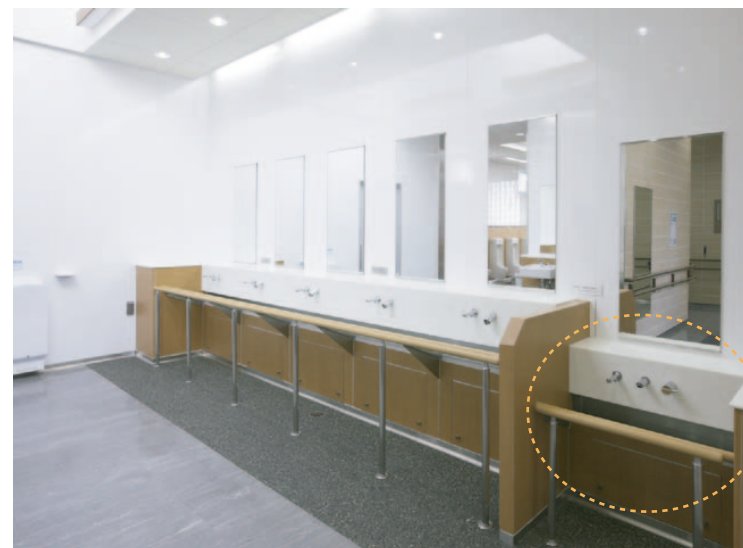
水受け部分が連続しており、床への水落ちが少なく清掃性を考慮。また、車いすのお客様でもご利用できるバリアフリー洗面台を採用。