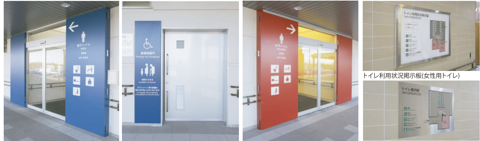
左から男性用トイレ、身障者お手洗い、女性用トイレの入り口。冬季の防寒のため、男女トイレの入り口には自動ドアを設置した。女性トイレは入り口近くの掲示板で利用状況を確認することができる。