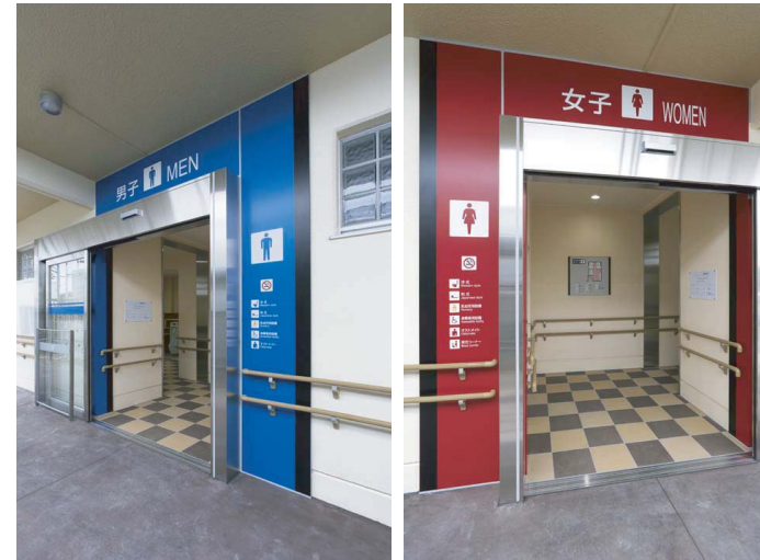
▲トイレ入り口まわり