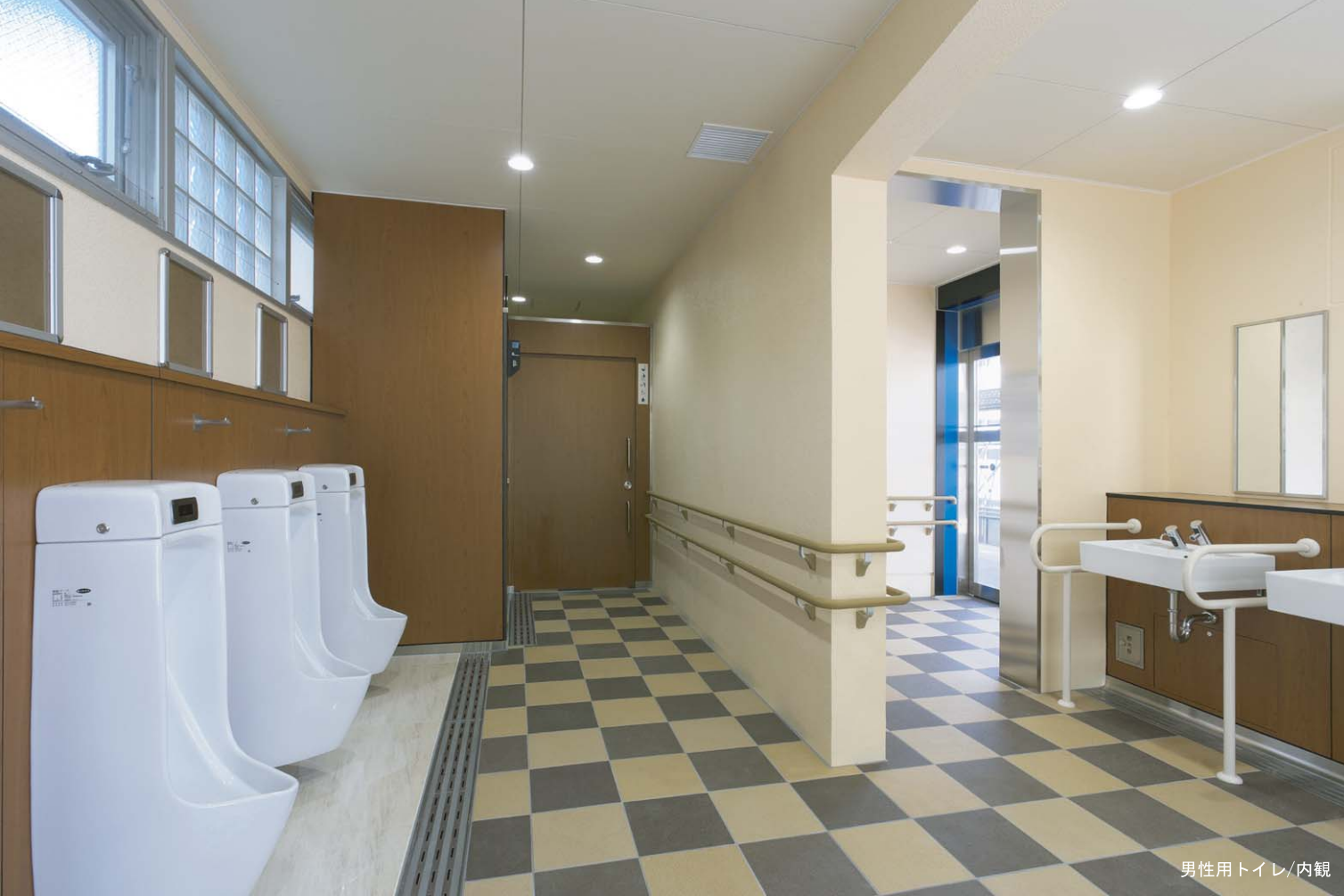
男性用トイレ/内観