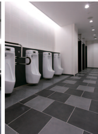
4F 男性用トイレ小便器まわり