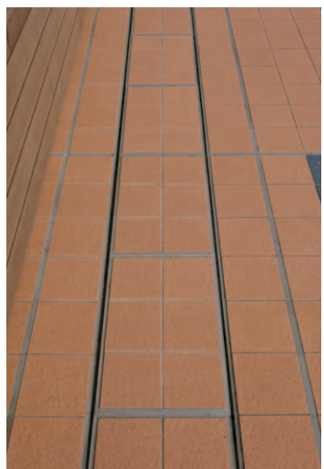
側溝部タイルディテールアップ