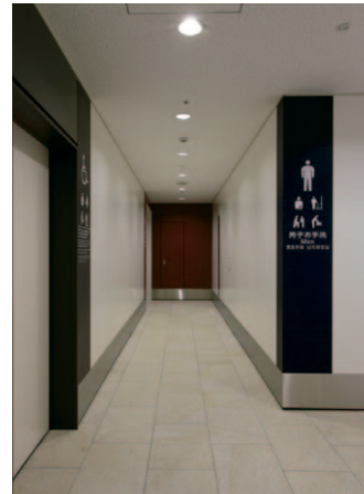
4F 男性用トイレ入口