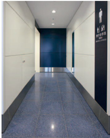
3F 男性用トイレ入口