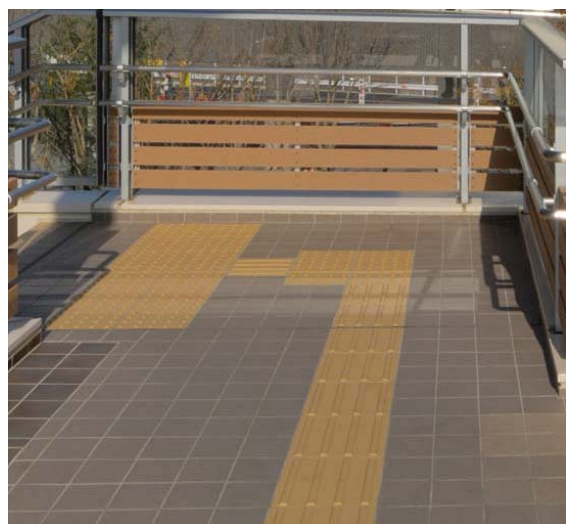
視覚障害者タイルの階段へのアプローチ