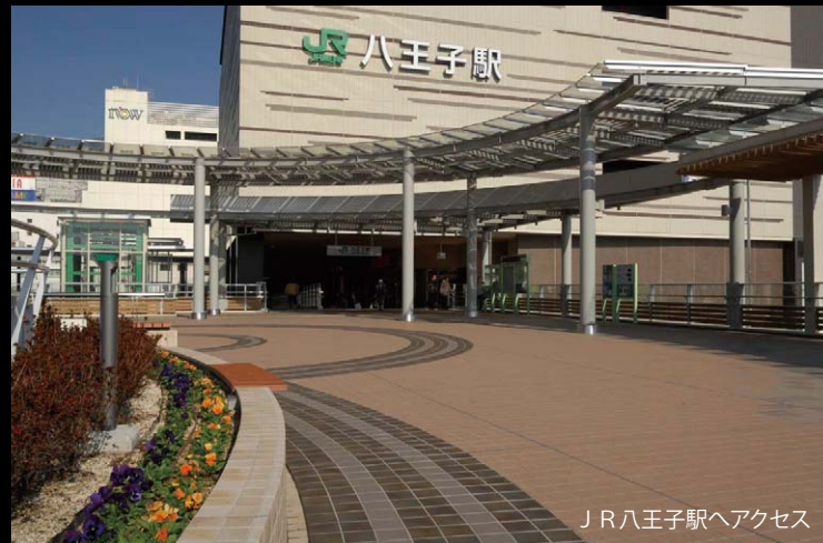
J R 八王子駅へアクセス

タワーを中心に駅前広場、J R 駅ビルなど各種施設を繋ぐコミュニティと相互アクセスを配慮しました。駅改札口と北口を繋ぐ南北自由通路に直結し、駅前の回遊性を配慮した「とちの木デッキ」は暖かみのある茶色をトータルカラーとしてまとめ、コミュニティスペースとしての賑わいのある空間になっています。焼物素材らしい質感を生かした路面デザインは、人々に華やかさと安らぎを与えます。