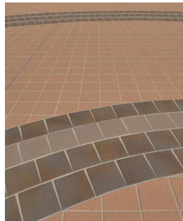
R部分との取り合い