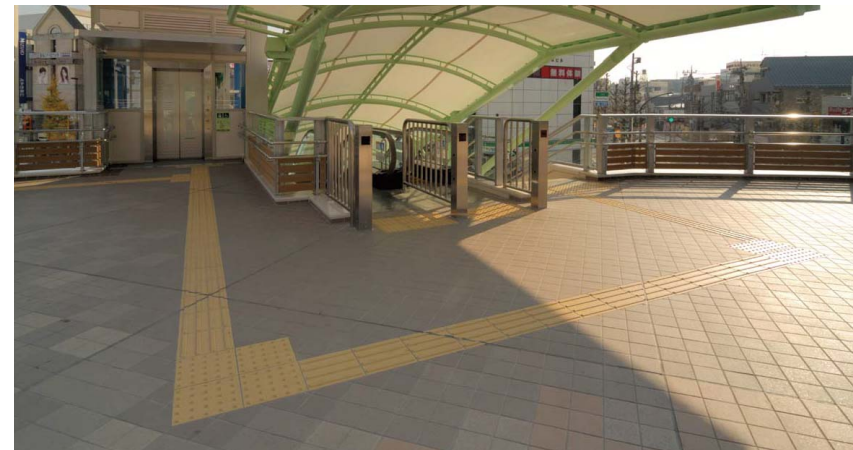
エスカレーター周辺