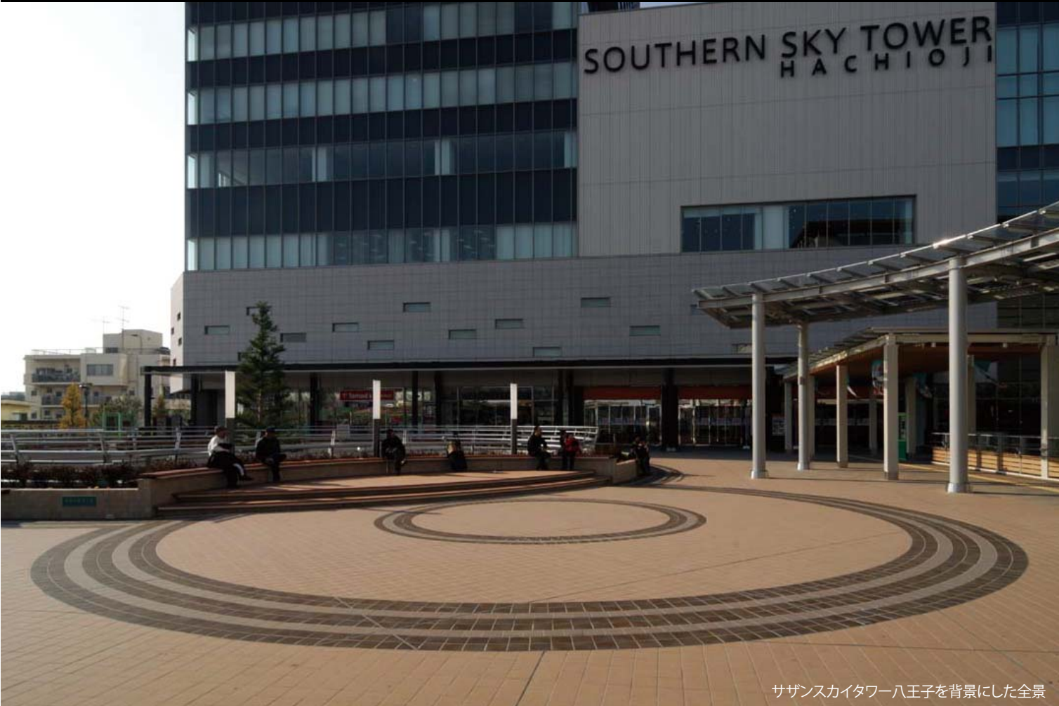
サザンスカイタワー八王子を背景にした全景