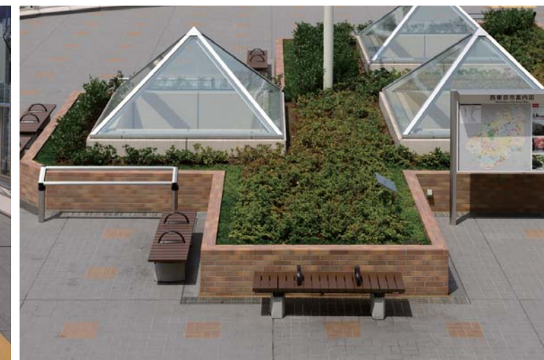
デッキ内花壇廻り