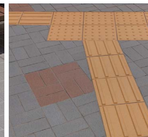
視覚障害者用タイル