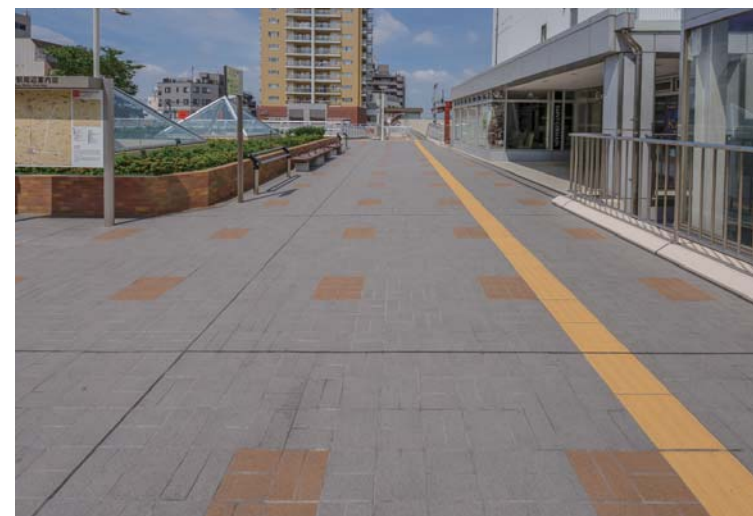
ショップ入り口前