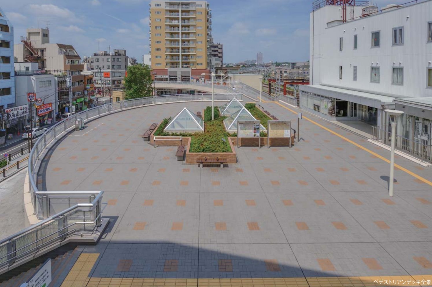
ペDESTリアンデッキ全景