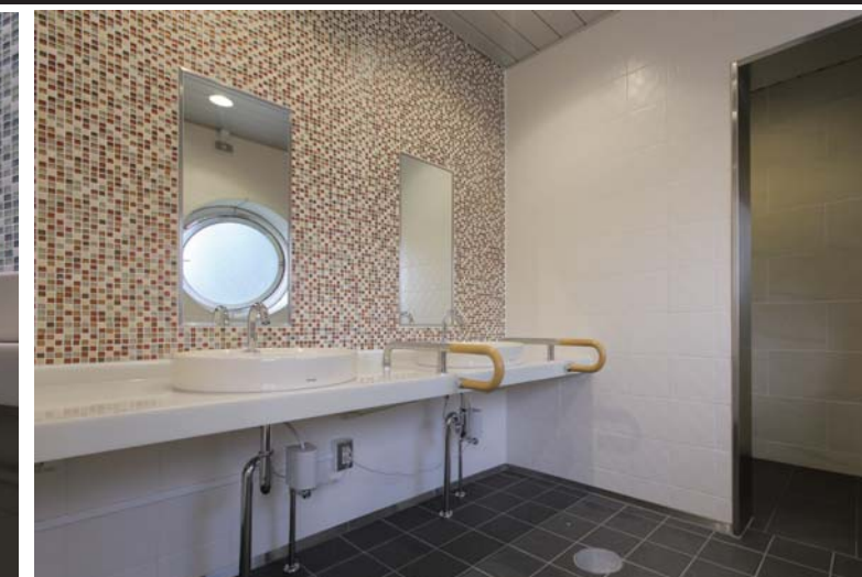
女子トイレ洗面まわり