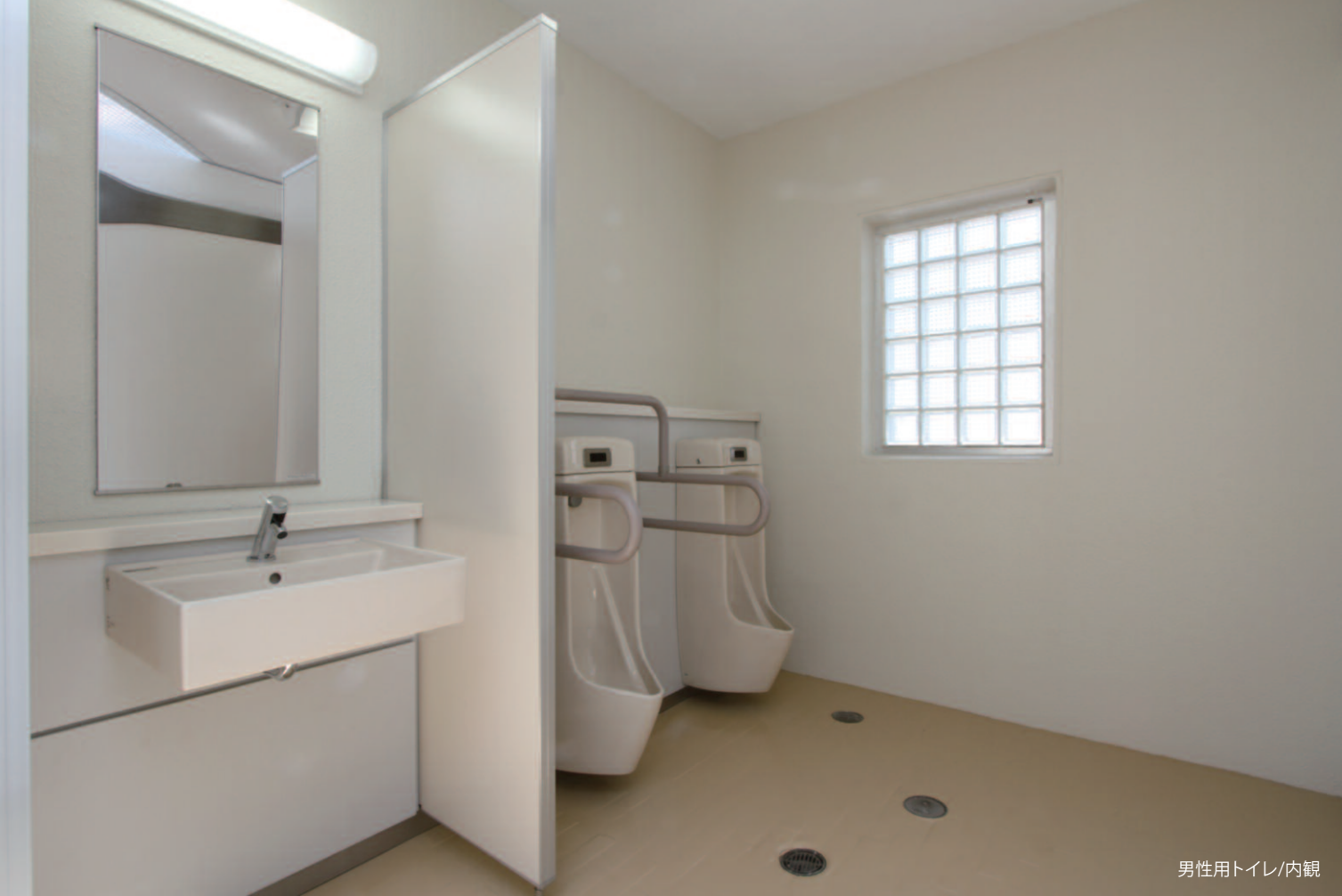
男性用トイレ/内観